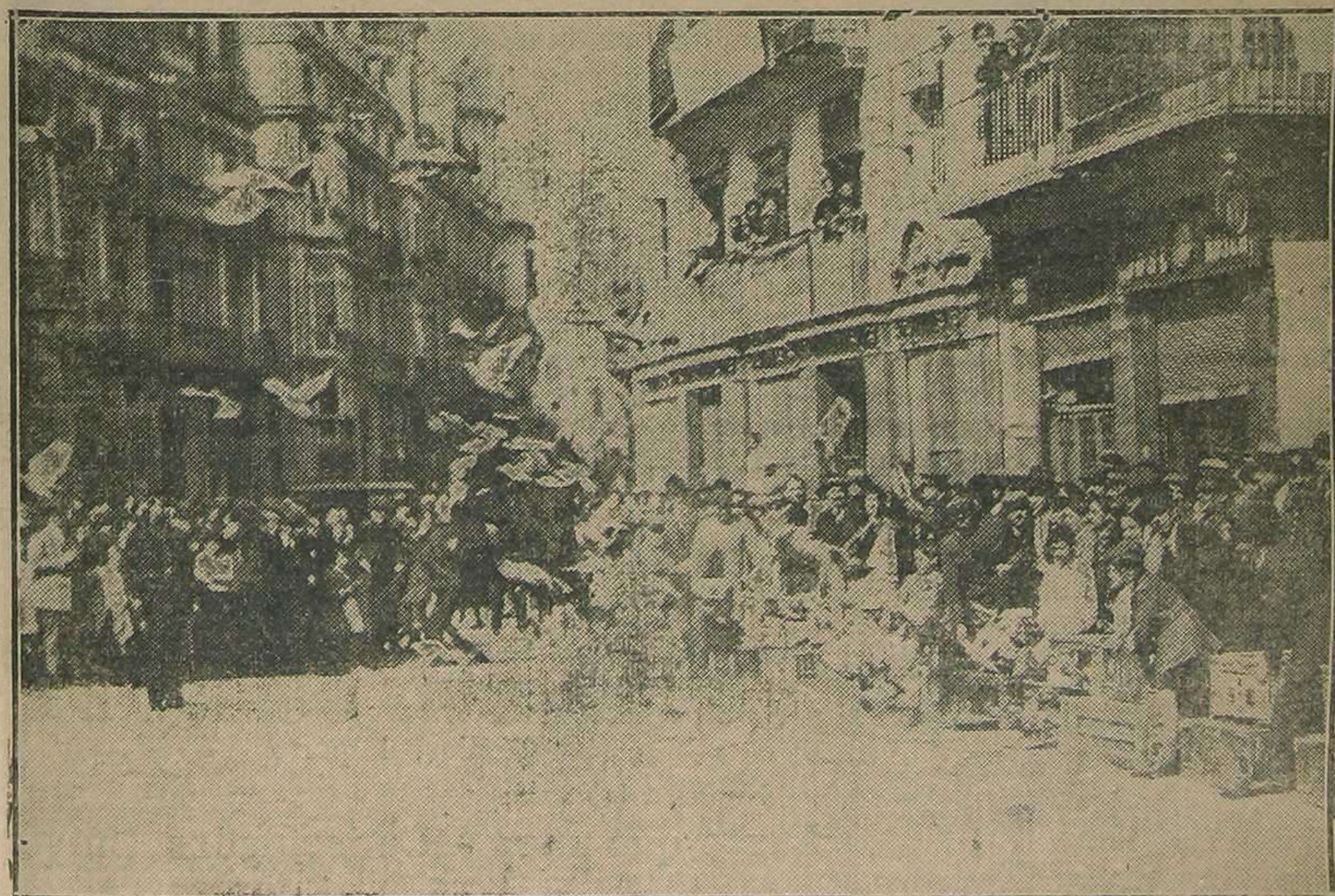
La suelta de las palomas al toque de Gloria, en la plaza de la Catedral.