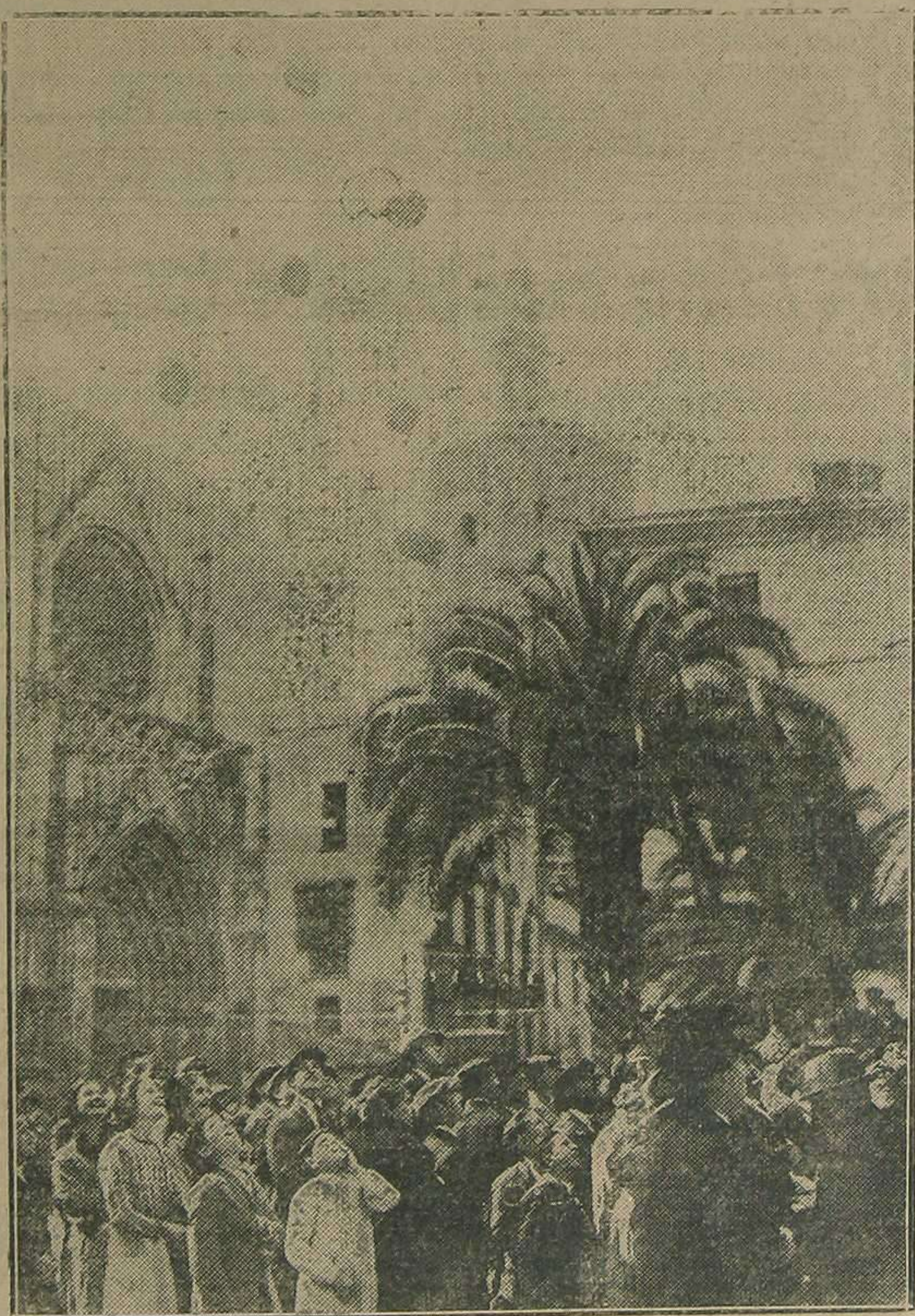
Elevación de globos de gas en el momento de tocar a Gloria.

EDITORIAL DEL DIARIO DE VALENCIA Trinquete de Caballeros, 14 Se hacen toda clase de trabajos de imprenta