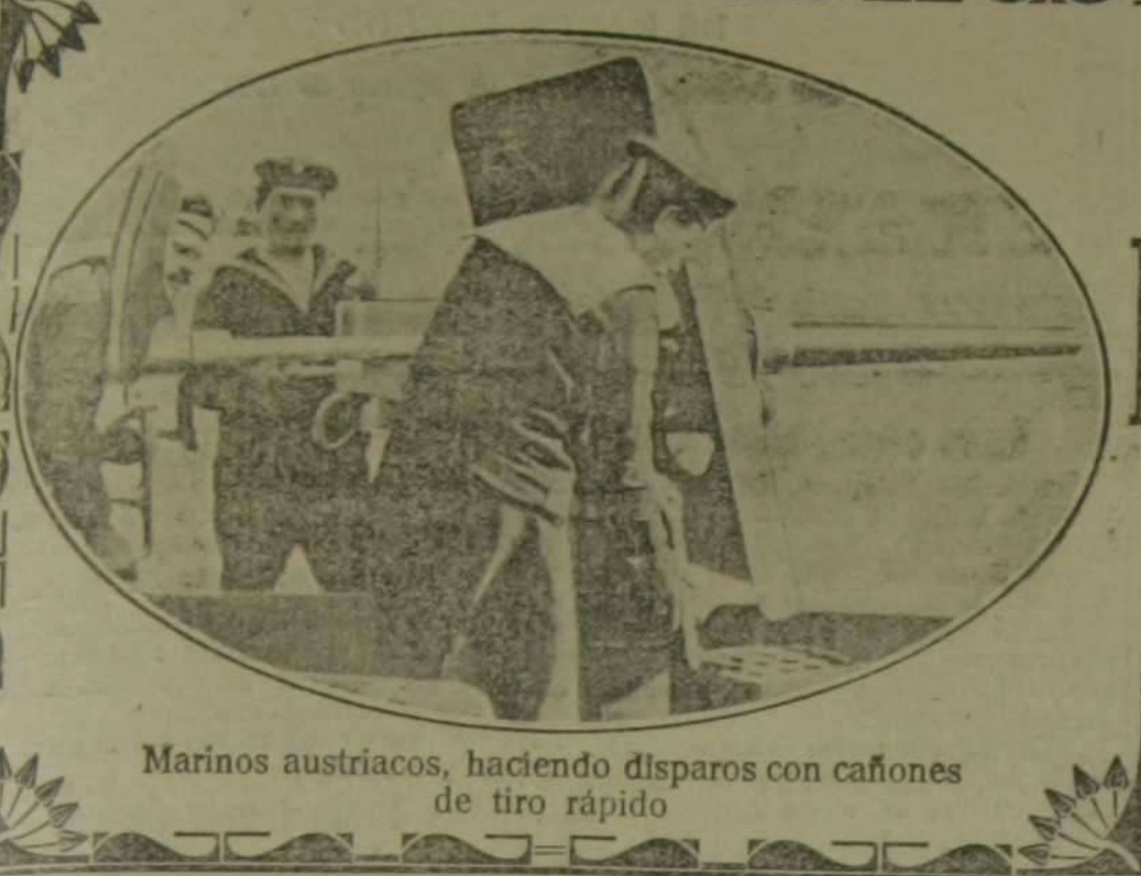
Marinos austriacos, haciendo disparos con cañones de tiro rápido

Año V. Oficinas: San Martín, núm. 2. Domingo 15 de Agosto 1915. Teléfono 681.---Apartado 122 Núm. 1599