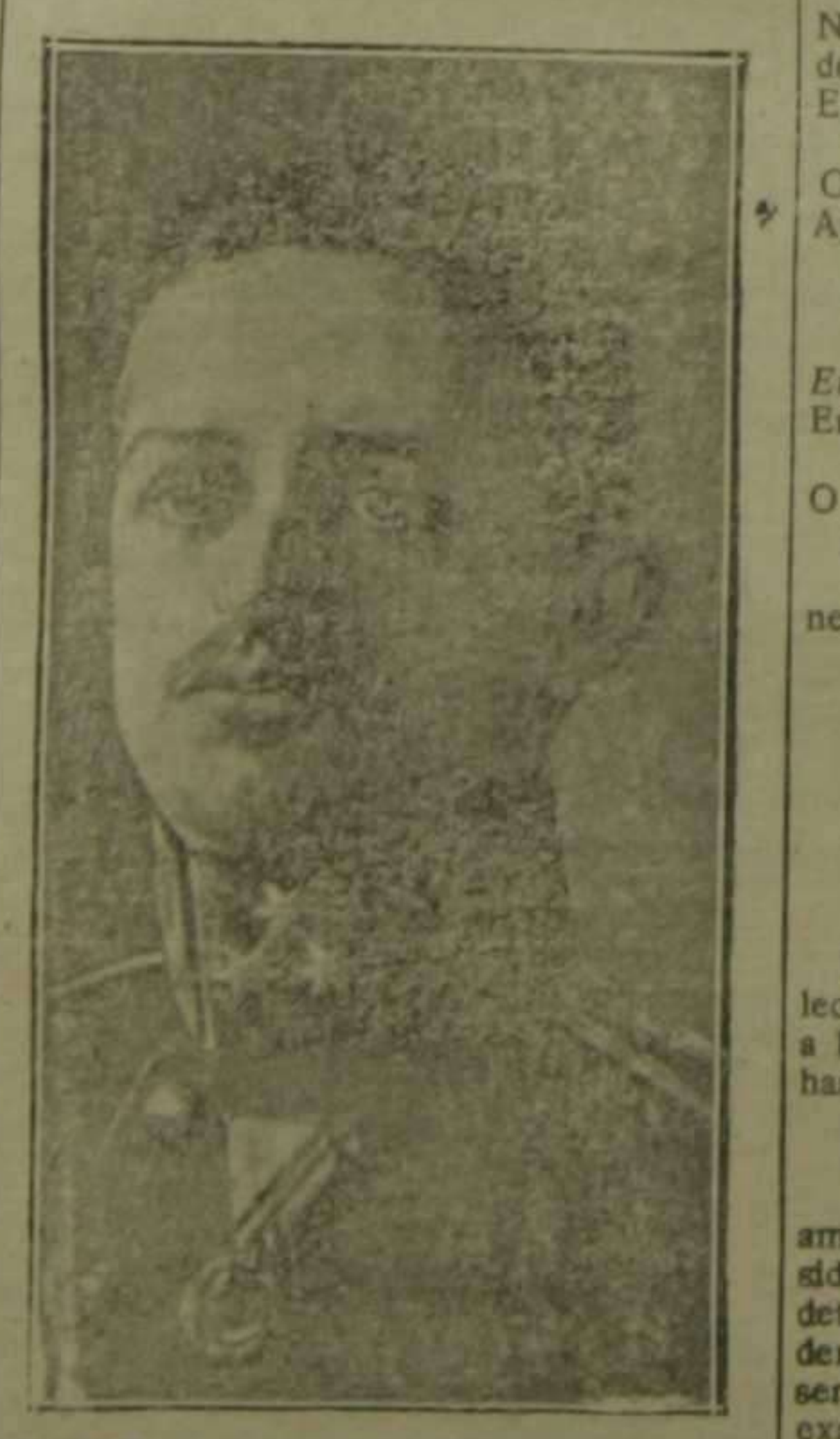
Archiduque Carlos Francisco José Heredero del trono de Austria

El nuevo Libro Rojo que Austria-Hungria publicó hace unos cuantos días está siendo comentado en Italia. Claro, el señor Sonnino contestará con otro Libro Verde, y empezará por negar todo lo que Austria-Hungria dice en su Libro Rojo de los políticos italianos, y Sonnino, de quien dicen los franceses que 'il n'a pas froid aux yeux', negará también todo lo relacionado con el agregado militar italiano en Viena, quien escribió mucho antes de la guerra a su Gobierno las siguientes palabras: "El ejército italiano podrá ocupar sin dificultad alguna Trieste, Fiume, Trento y todas las ciudades del Sur de Austria, y su marcha a Viena será para nuestros soldados un simple pasito militar." Como quiera que el señor Sonnino es muy hábil y sabe manejar la pluma con mucho arte, acaso llegue a convencer a sus propios amigos. A las personas que estén al corriente de los asuntos de política internacional no podrá convencerlas el señor Sonnino, porque por overdo que resulte su libro, más overdo es la actitud que concluyó su Tratado de alianza con los imperios centrales. Yo hallo ridículos y hasta inne-