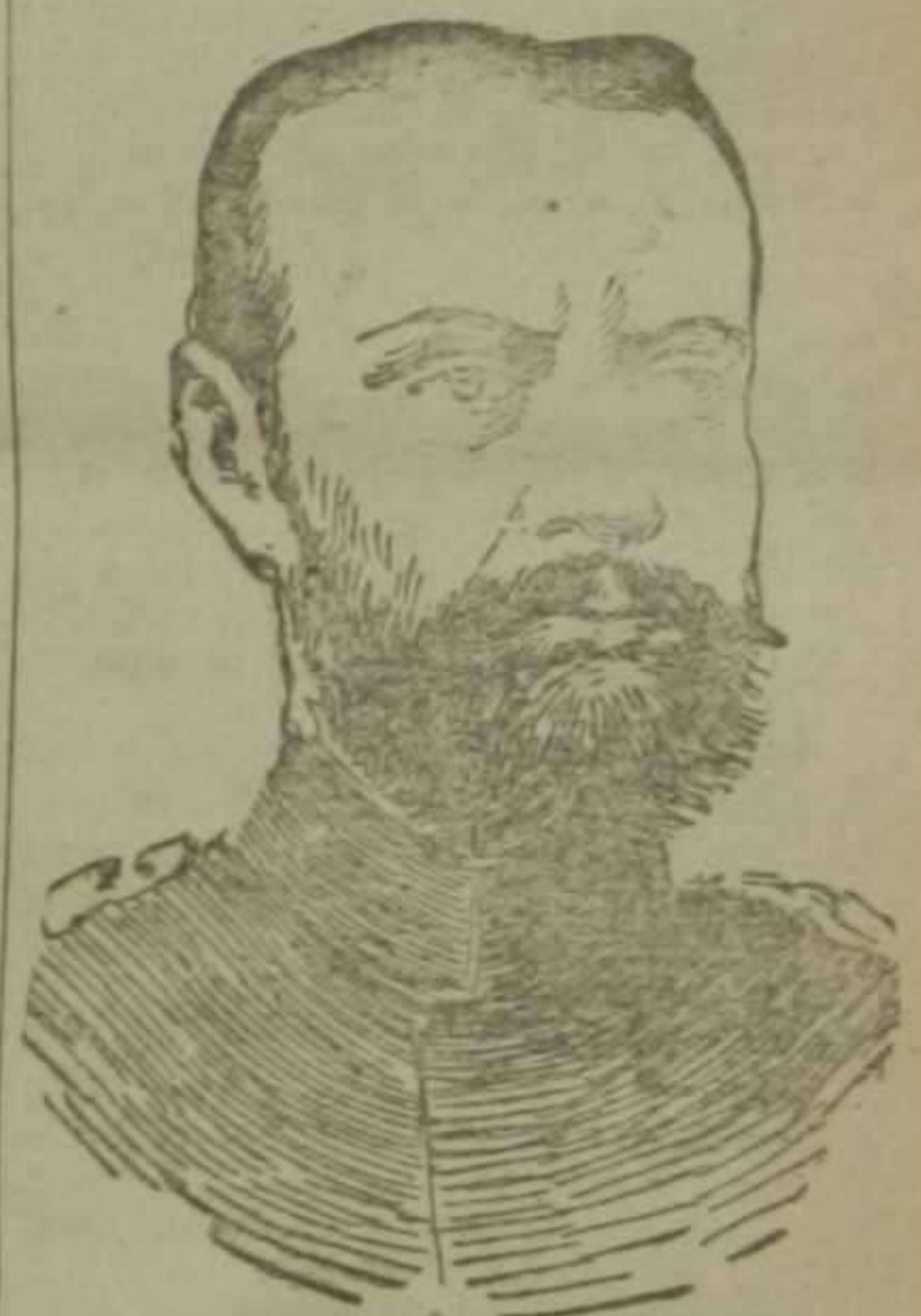
El principe Leopoldo de Baviera

El articulista referido emplea indistintamente las palabras autonomía y autarquía, como si se tratase de lo mismo. No es igual, sin embargo. Autonomía significa darse uno la ley a sí, y autarquía vale tanto como regirse a sí. Autonomistas son los catalanistas y los bizkaitarras; nosotros somos partidarios de la autarquía, que es un término, ¿cómo lo diré?, menos separatista, porque no ataca a la unidad moral de la Patria, que podría resentirse con el empleo de la autonomía. No está tampoco justificado el odio de los jóvenes valencianistas a las restantes regiones de España, y en especial a Castilla, Castilla, como toda la nación española, es víctima del caciquismo y del centralismo. No es ella la que oprime, sino el poder central el que mata la vida de las regiones. En resumen, pues, el error de los valencianistas consiste en olvidar que hay una sociedad natural que se llama región, y en querer llenar este olvido con la idea de nación, que es una entidad superior, compuesta de regiones, y en querer aplicar la ley propia de la nación a una sociedad inferior en grado, cual las regiones son. Nosotros somos regionalistas con respec-