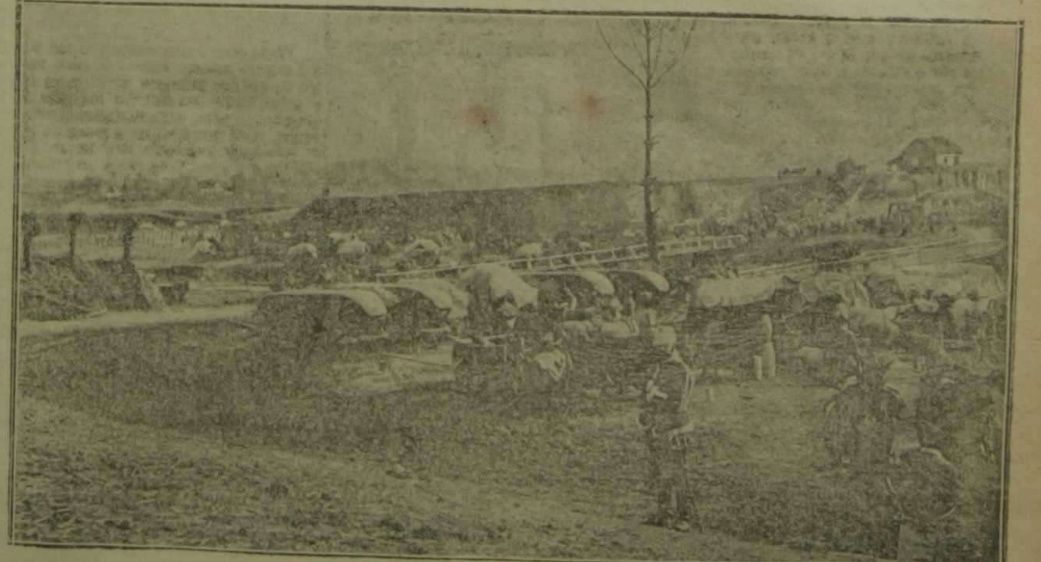
Depósito de reservistas del segundo cuerpo austriaco, cerca de Harmanovice