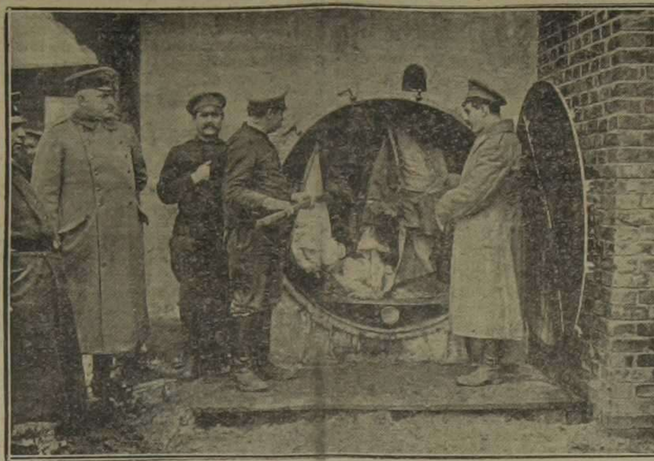
Local destinado a la desinfección de las ropas de los prisioneros rusos en Cuba.