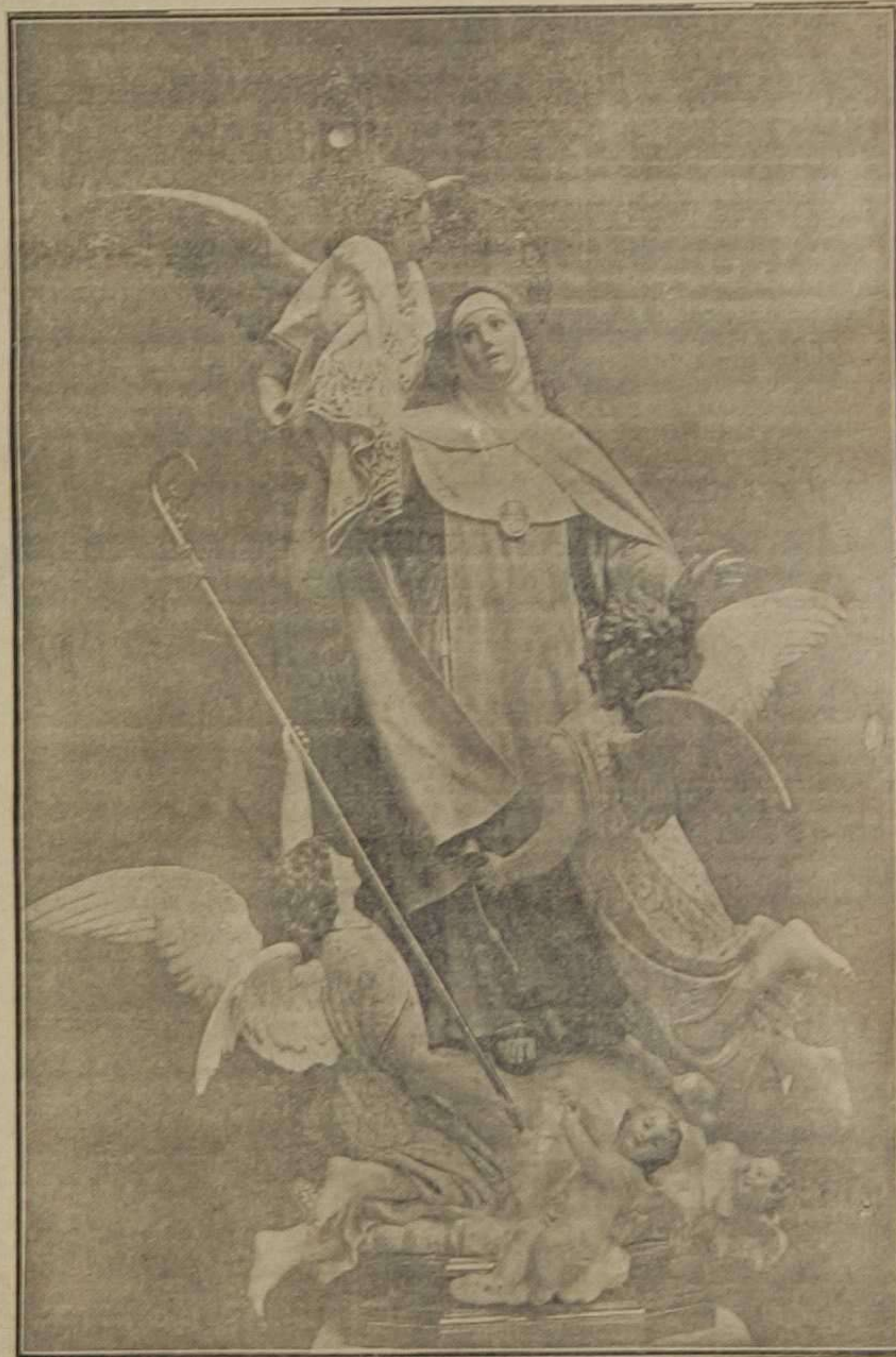
El tránsito de Santa Clara

Preciosa obra de arte realizada por el notable escultor D. Modesto Quilis.