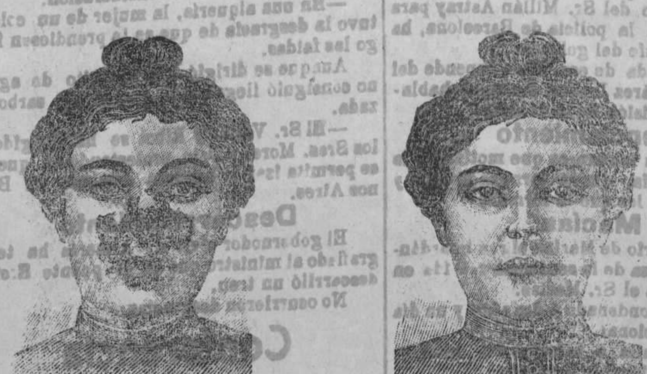
Antes de la curación (izquierda) y Después de 15 días de tratamiento (derecha)