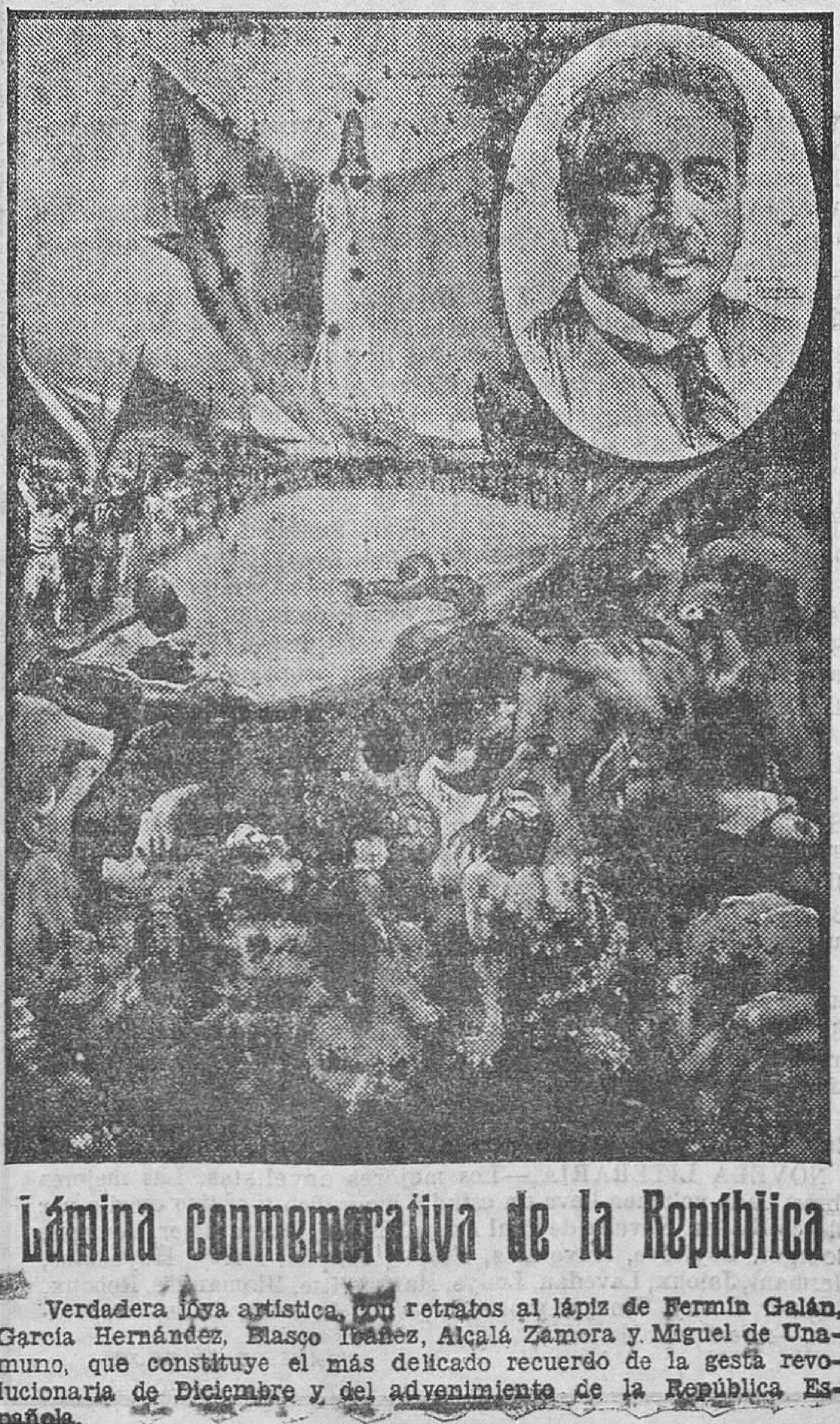
Lámina conmemorativa de la República Verdadera joya artística, con retratos al lápiz de Fermín Galán, García Hernández, Blasco Ibáñez, Alcalá Zamora y Miguel de Unamuno, que constituye el más delicado recuerdo de la gesta revolucionaria de Diciembre y del advenimiento de la República Española.