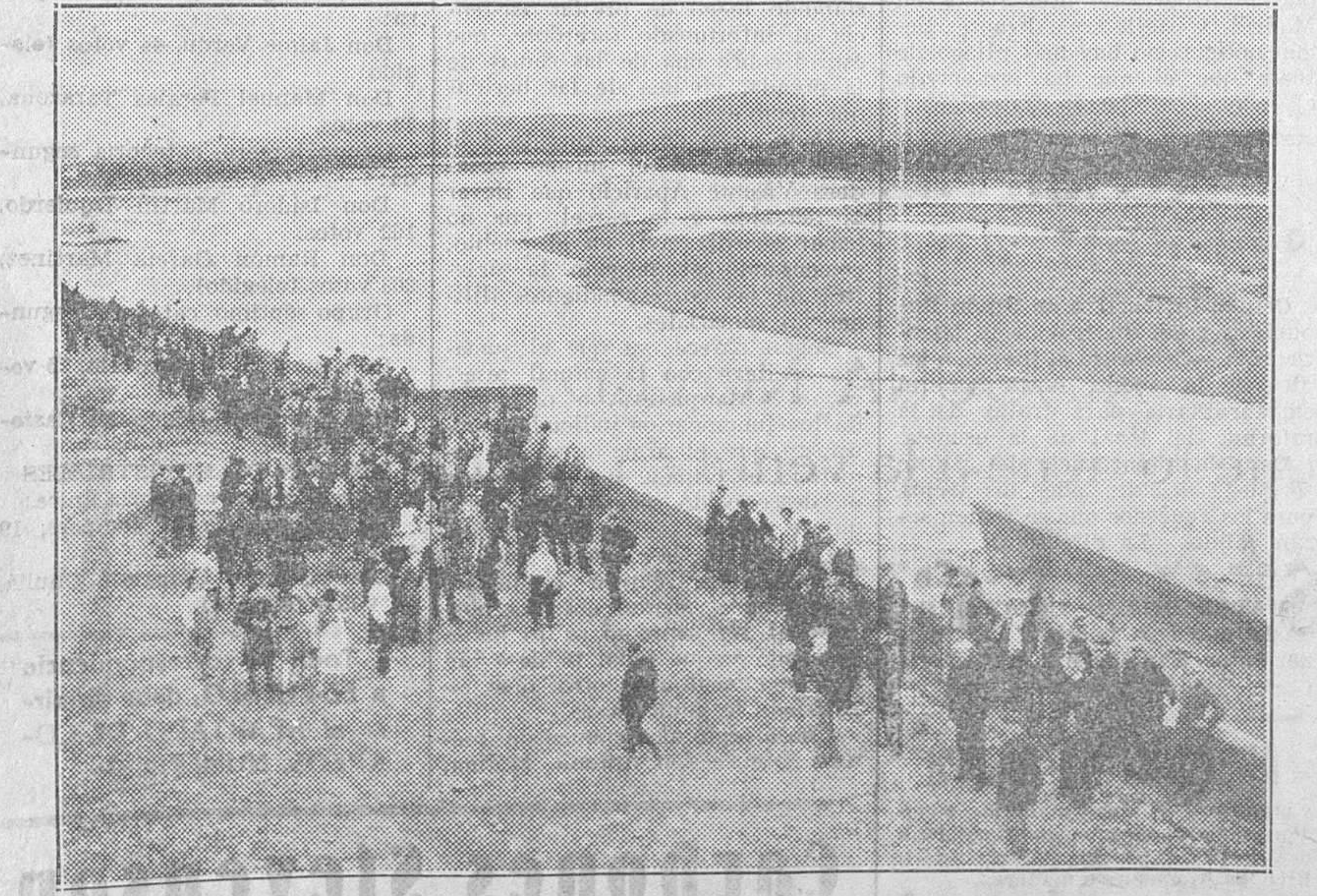
Vista general del río, a las tres de la tarde, después de haberse mainado la avenida. Las aguas habían disucentemente y dicen que no se pueden construir malecones con piedra suelta, cuando han de ser batidos por corrientes tan impetuosas