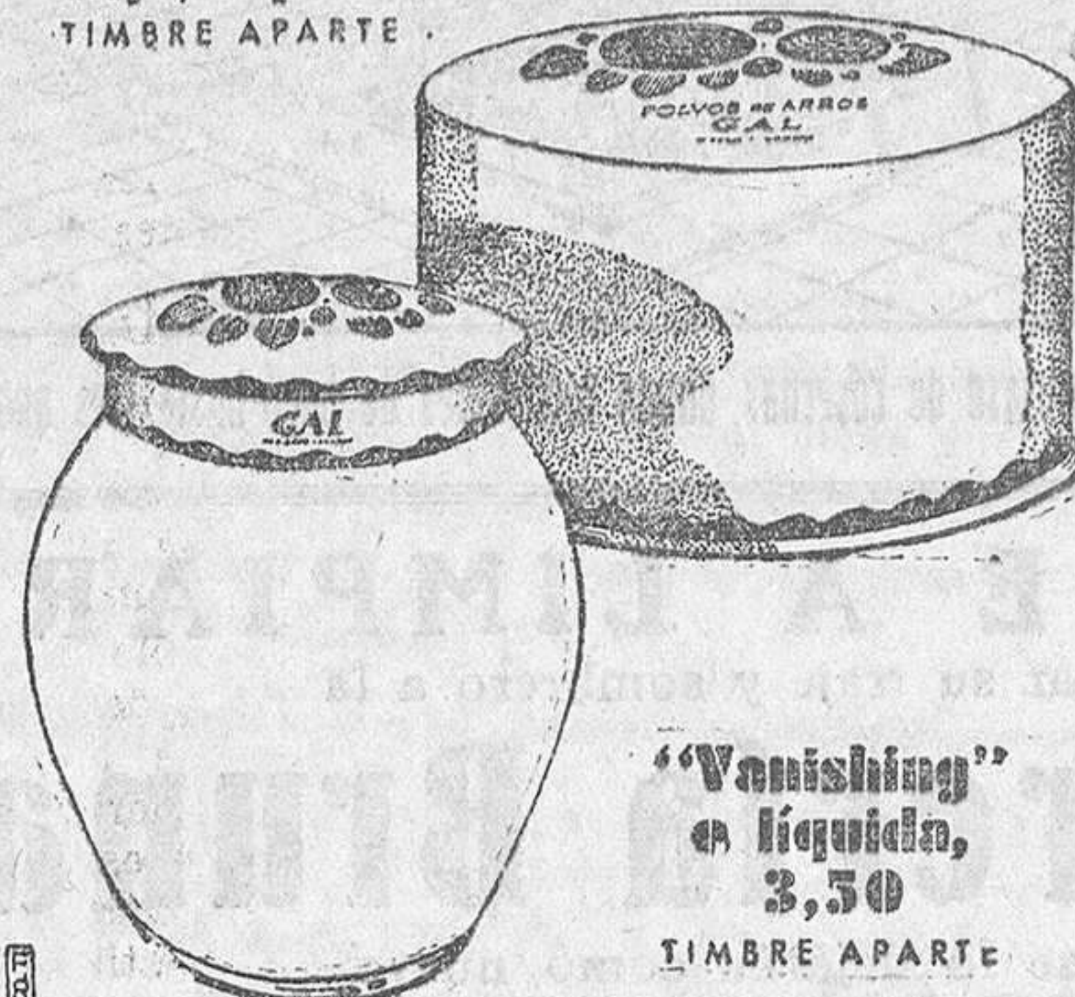
"Vanishing" líquida, 3,50. TIMBRE APARTE