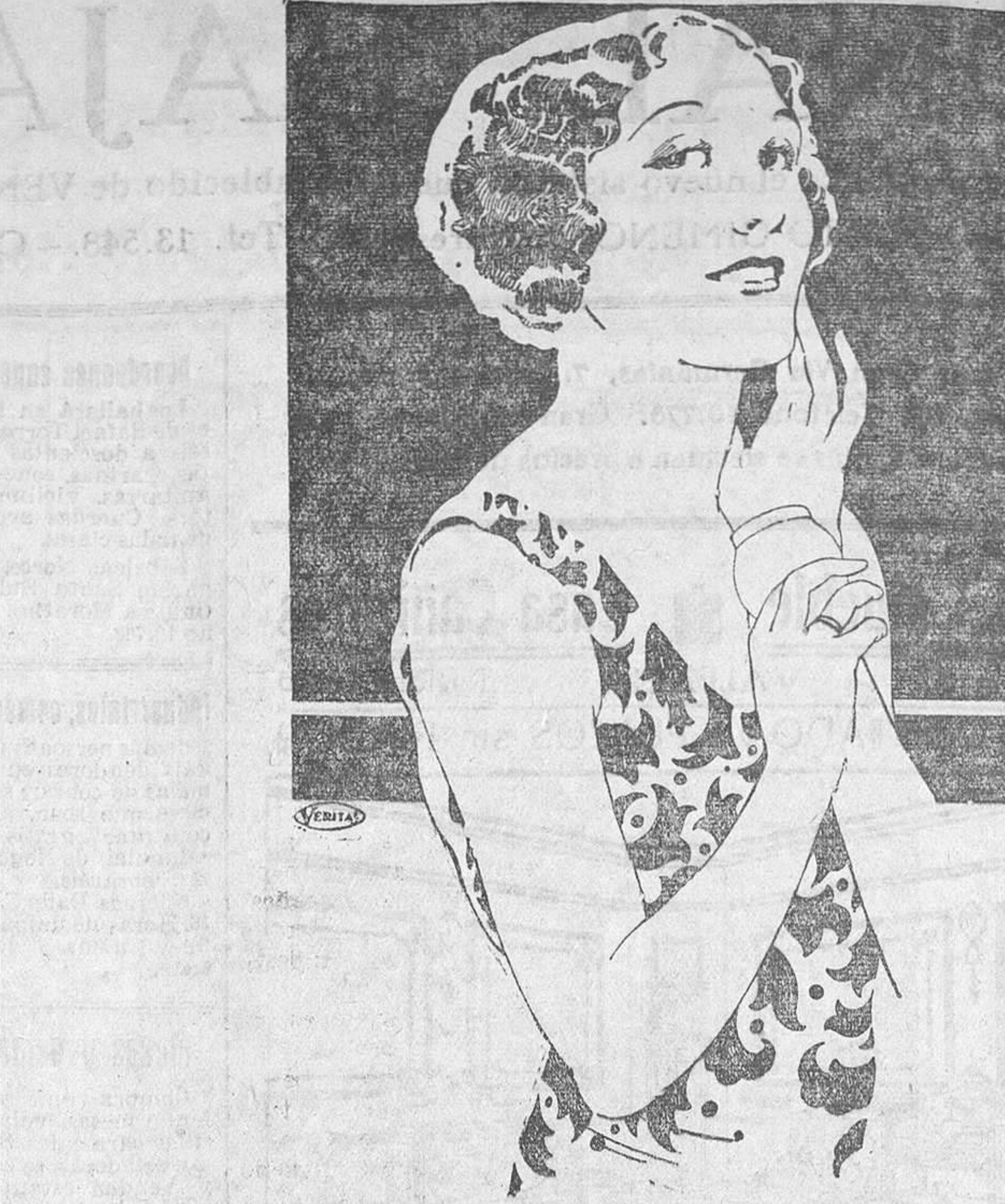
Caja, 2 ptas. TIMBRE APARTE

La victoria por equipos la consiguieron los corredores del club de Gandía, por lo que el Gimnástico se clasificó en primer lugar por gran ventaja de puntos sobre los demás.