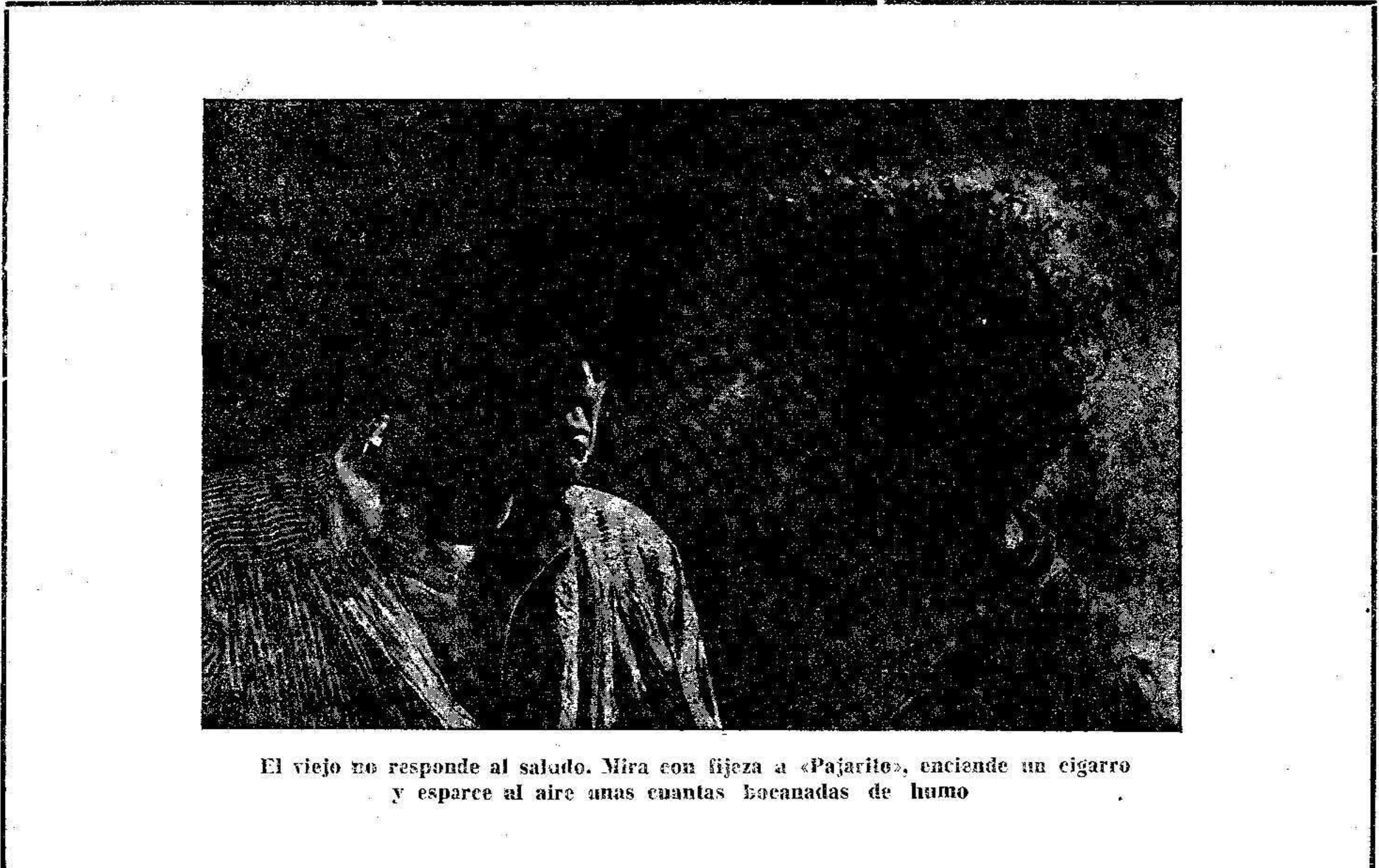
El viejo no responde al saludo. Mira con fijez a «Pajarito», enciende un cigarro y esparraca al aire unas cuantas bocanadas de humo

Cuando el pastor, después de las disculpas al amo, enforzó la calleja para subir de nuevo el hato, no vio que por una de las travesaeras venía a todo el gajelo de su caballo, un chiquillo, casi un niño. Poco le faltó a Antón para