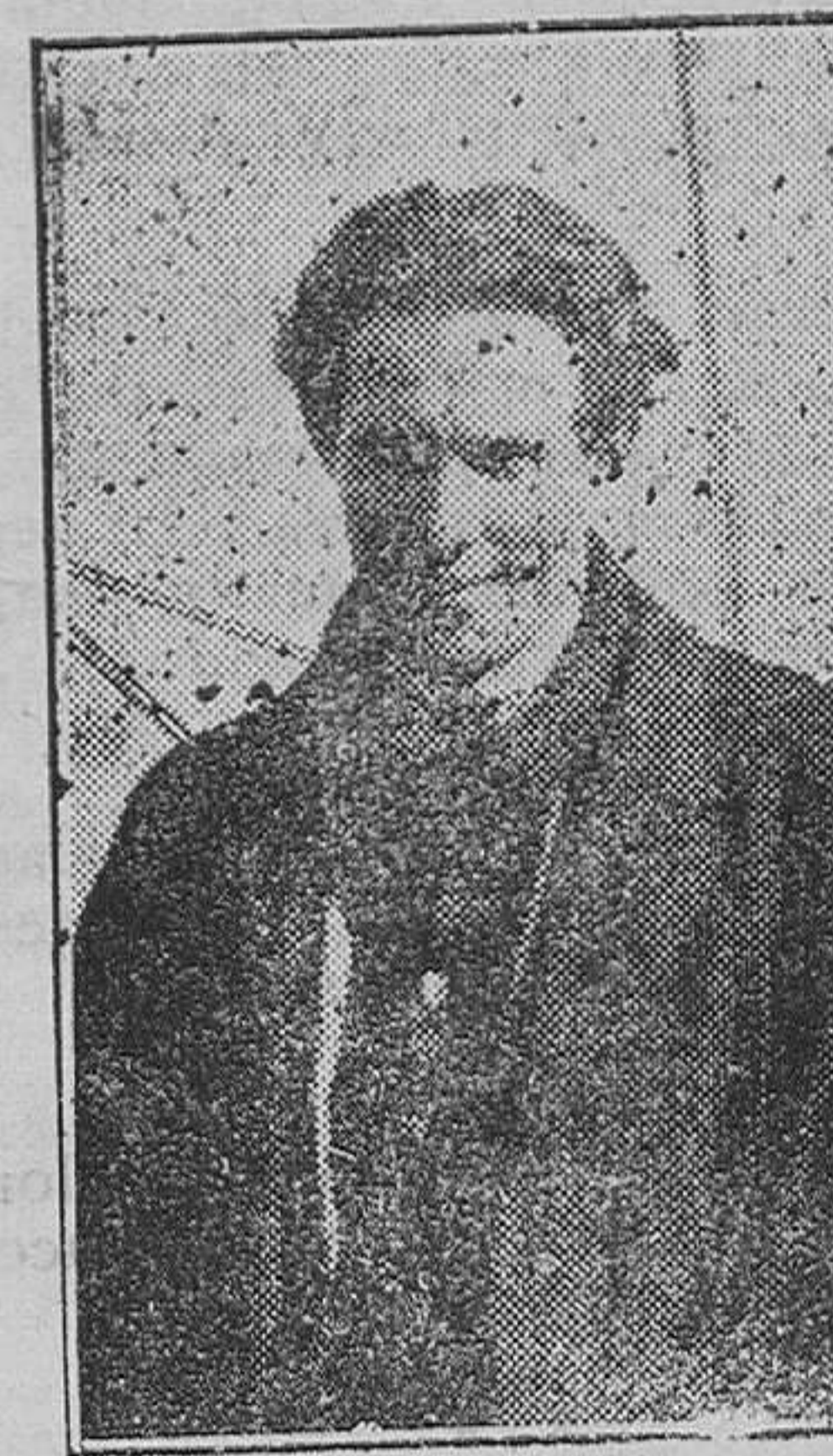
El aviador Mermos, que durante dos años estuvo efectuando el recorrido de Toulouse-Barcelona-Alicante-Málaga y que acaba de batir el record del mundo en hidroavión con 30 horas 25 minutos de vuelo cubriendo 4.800 kilómetros y que se propone intentar la travesía del Atlántico