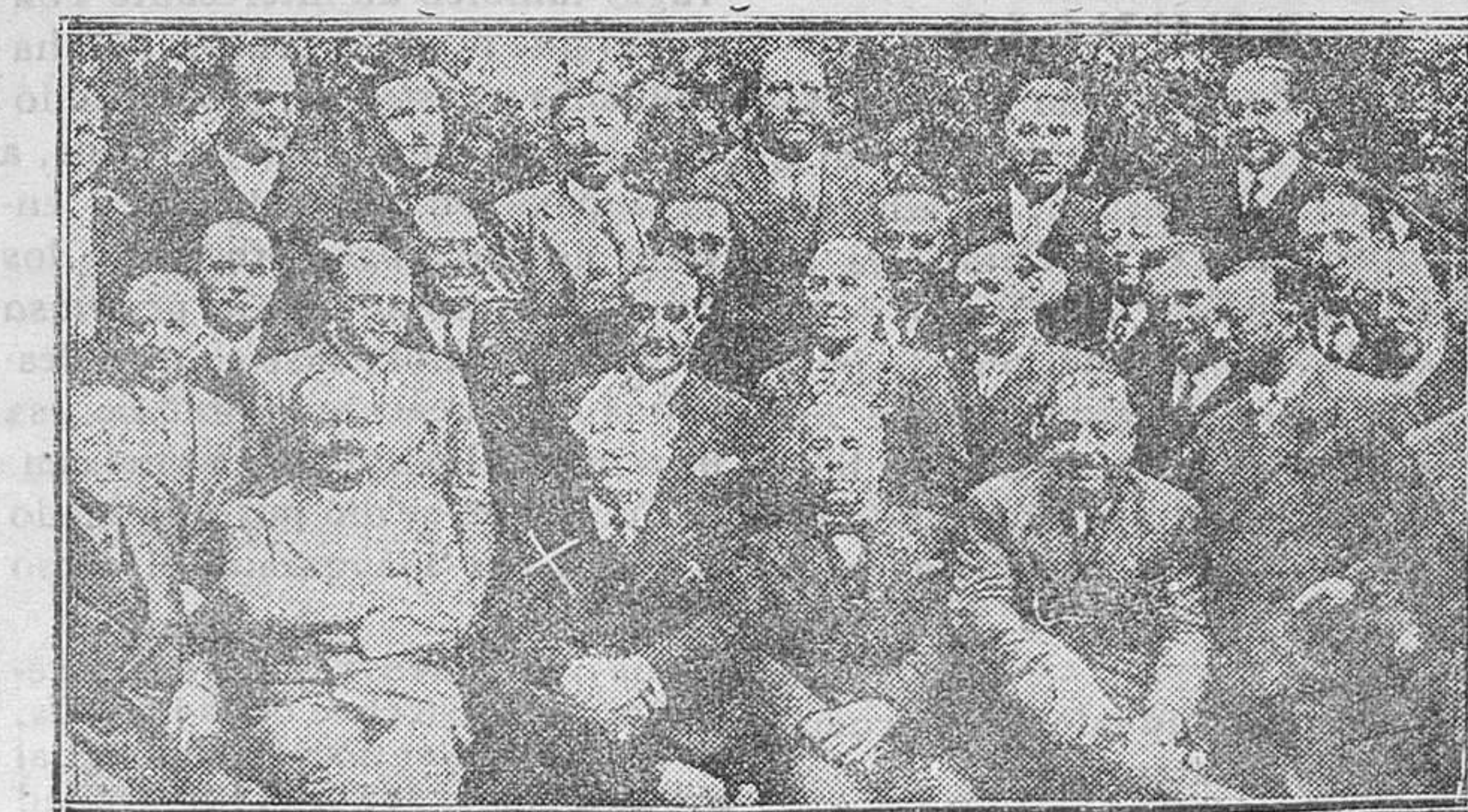
EL CONGRESO RADICAL.—El señor Lerroux rodeado de los delegados de las provincias gallegas en la visita de despedida al jefe