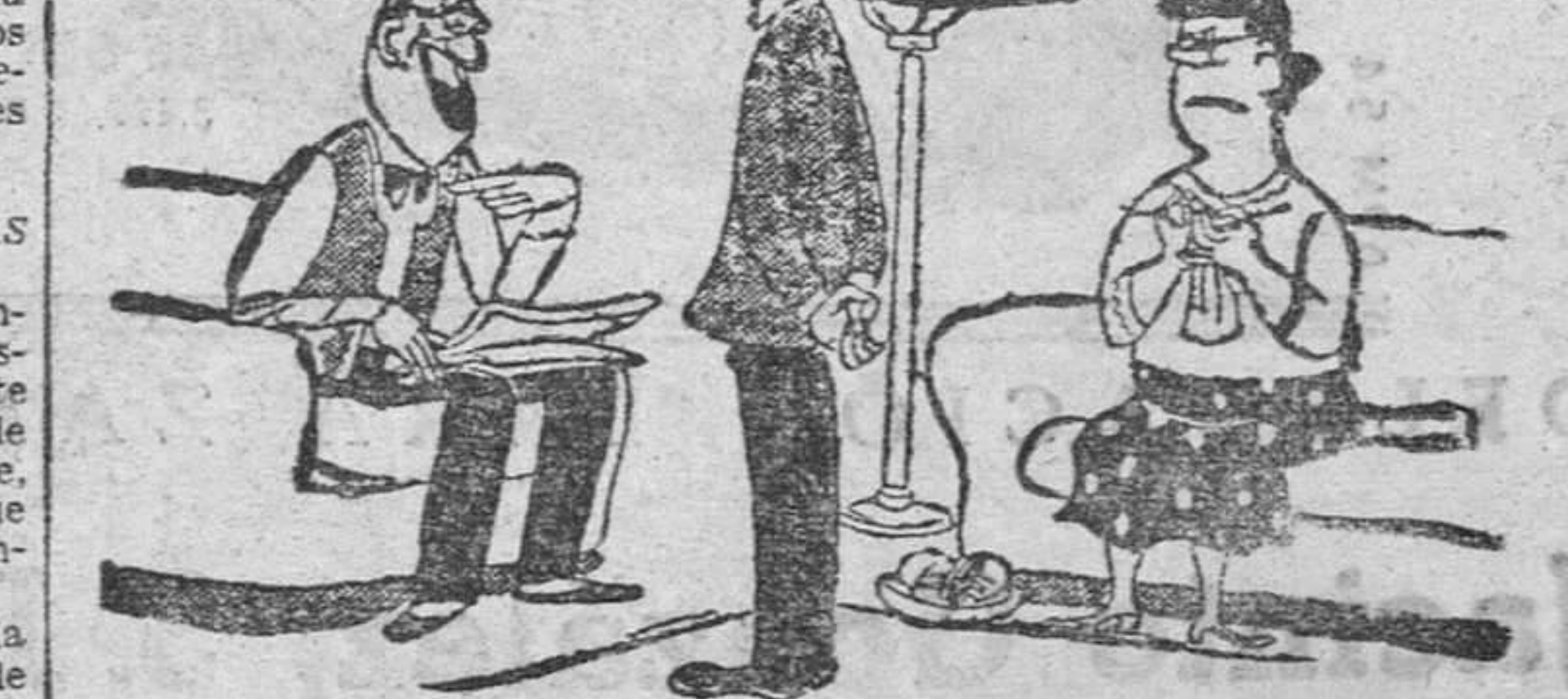
—Yo, a tu edad, ya obedecía a tu madre.