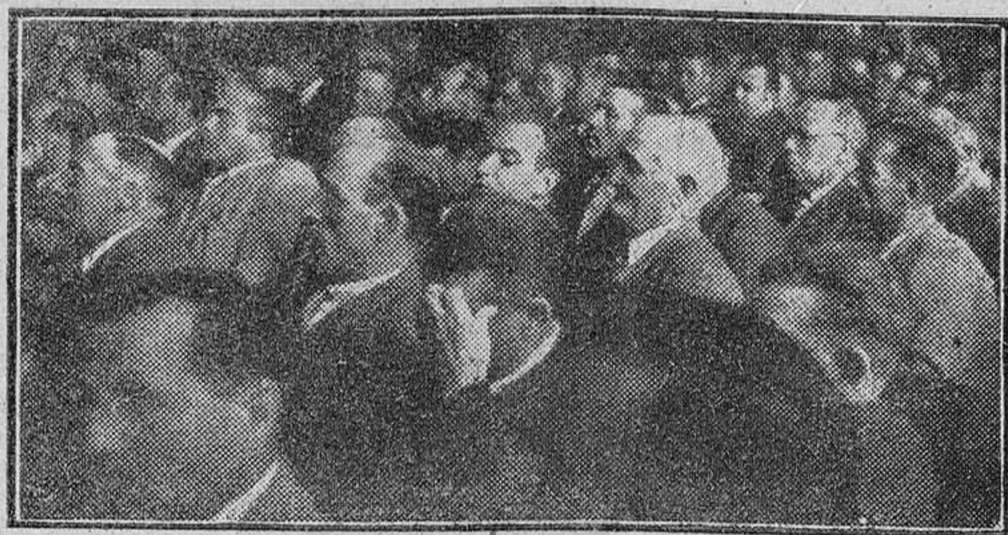
Asistentes al Congreso Sindical Agrario del Duero, en la sesión de clausura