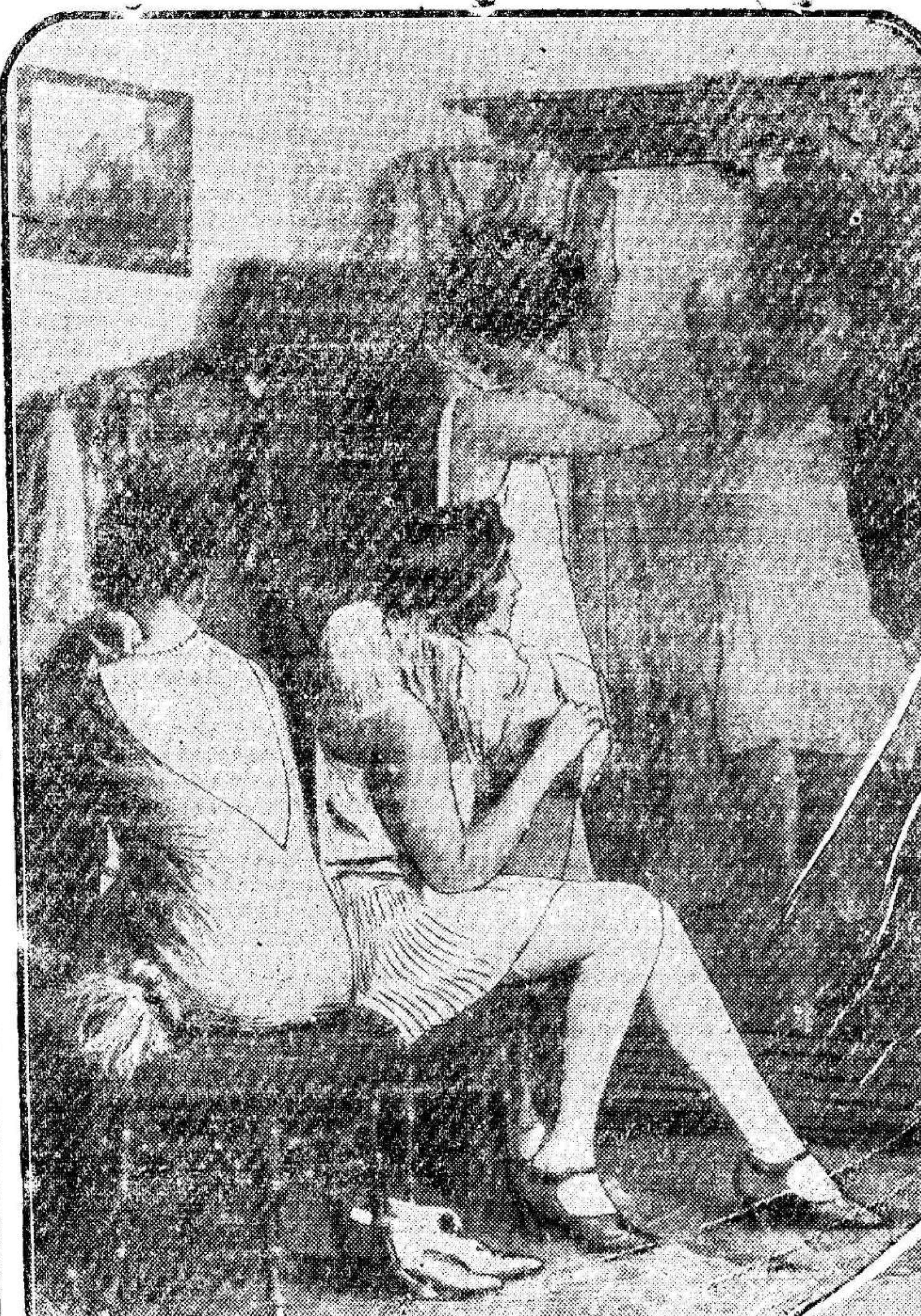
Completando la información gráfica que publicamos ayer referente a las Academias de Baile, damos hoy otro aspecto de dichas Centros de enseñanza, en el que aparecen las alumnas preparándose en la guardarropía para comenzar la lección de baile.