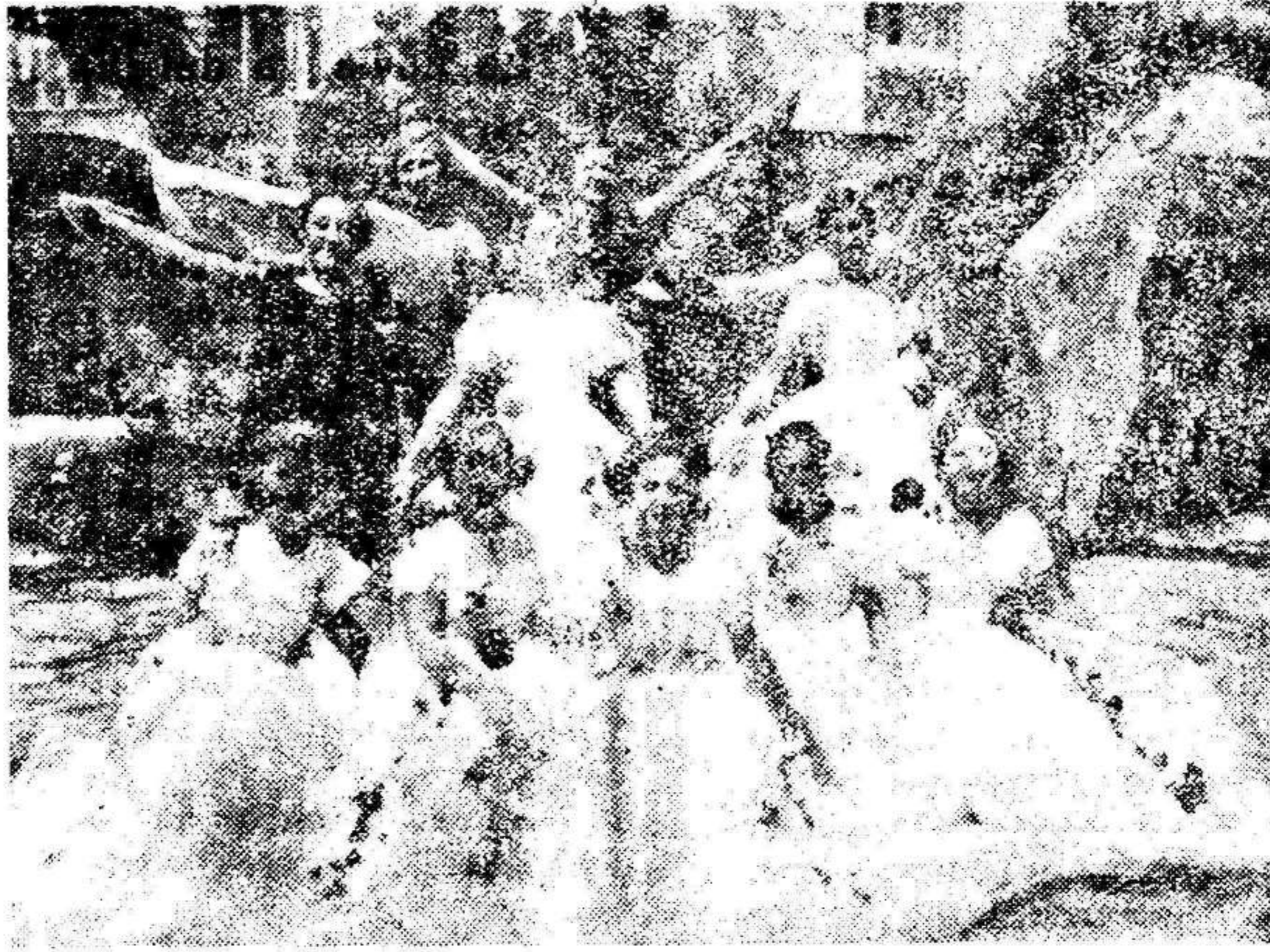
UN GRUPO DE DISTINGUIDAS SEÑORITAS QUE INTERVIENEN EN EL FESTIVAL