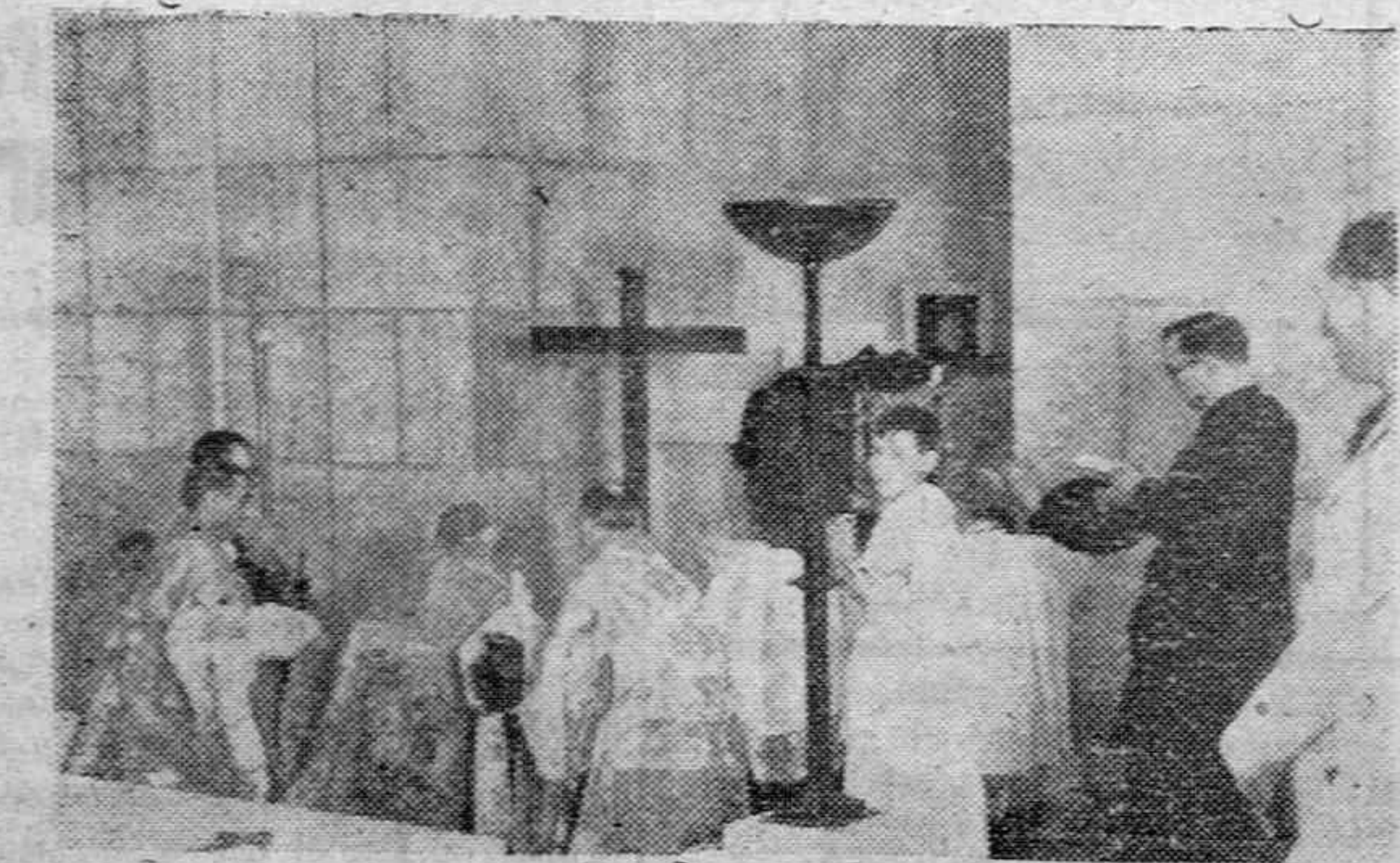
Acto de la bendición de la cripta del Alcázar de Toledo en el aniversario de su liberación.

Ayer tuvo ocasión el público vitoriano de contemplar un interesante espectáculo. A la una de la tarde y a las seis y media, el paracaidista "Zamariego", que con tanto éxito viene actuando en diversas localidades, hizo un par de exhibiciones de sus ejercicios, lanzándose en paracaídas desde lo más alto de la casa número 2 de la calle de Otaguibel. Un gran gentío se agolpó a las dos horas en los alrededores, elogiendo la decisión de "Zamariego", aunque la poca altura desde que se lanzó impidió que el espectáculo tuviera grande emoción.