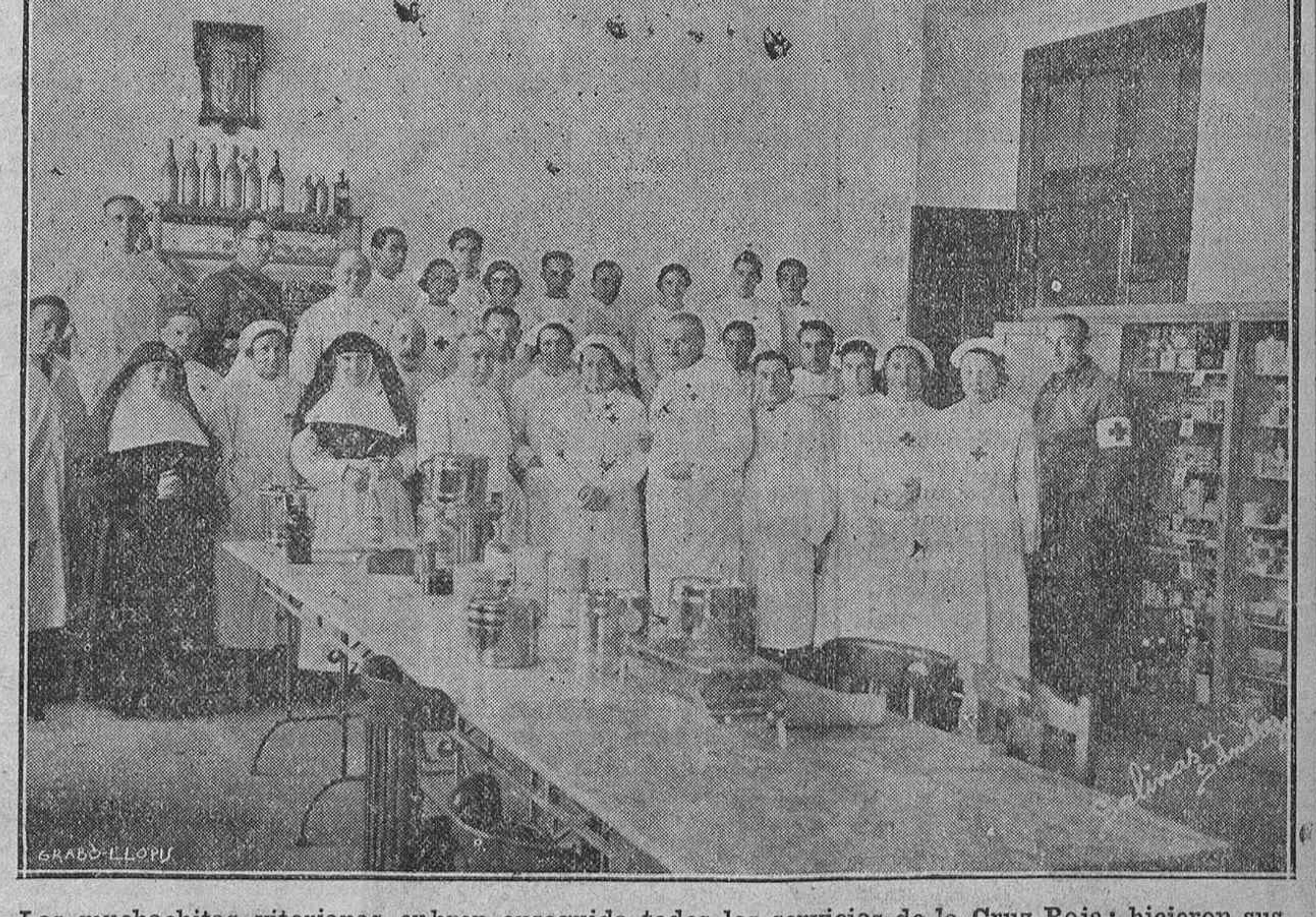
La actividad de los directivos de la Cruz Roja Española en Vitoria fué ejemplar y modelo desde los primeros días del Movimiento. Mañana es el día de la Colecta anual pro Cruz Roja que tiene por Patrona a la Inmaculada Concepción