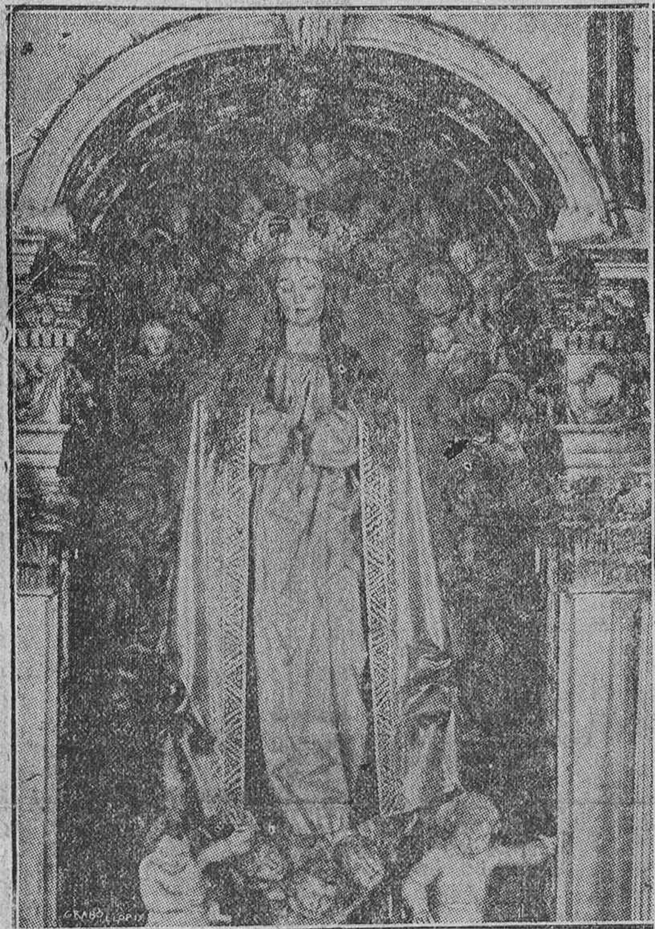
Todo Vitoria se ha prosternado estos días ante esta imagen preciosa y mayestática de la Inmaculada en la Parroquia de San Miguel.

Funciones finales del Novenario. - Colecta para la Cruz Roja Española. - Fundación de la Congregación de los Kostkas