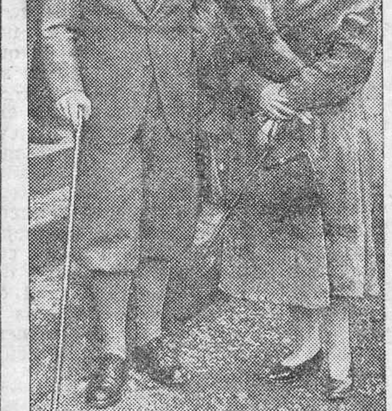
Los reyes de Grecia, que con motivo de la fiesta nacional helénica han recibido un expresivo mensaje de felicitación de Hitler.

Los obreros evacuaron los locales en la tarde de hoy, aceptando el compromiso de los patronos de no trabajar nadie y de no efectuar ninguna venta.