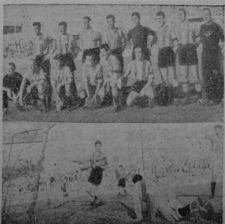
El once del Mataró que tan brillante actuación tuvo en Son Canals. -- El primer gol obtenido por los visitantes

Los albiazules palmesanos si-guen sin ofrecer a su público, el partido, la actuación lucida que se espera y desea para que se confirmen sus buenas actuaciones por los campos peninsulares. El encuentro que el equipo del Atlético Baleares jugó el domingo en su propio feudo dejó bastante que desear y decepcionó a sus partidarios, quienes demostraron no estar conformes con el rendimiento de los componentes del once, la alineación algo rara del ataque y el que permanecieran en las tribunas elementos que de seguro hubieran dado más rendimiento del que dieron algunos de los que jugaron. Las censuras que se escuchaban al abandonar el público Son Canals, eran agrias y exageradas bastantes de ellas, pero algunas estaban razonadas.