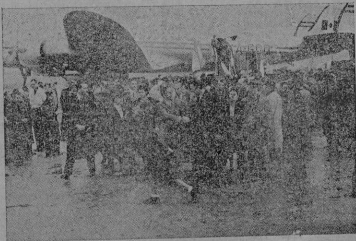
Un aspecto de la llegada del avión mejicano "Versacruz" en su viaje inaugural de la línea Méjico-Madrid