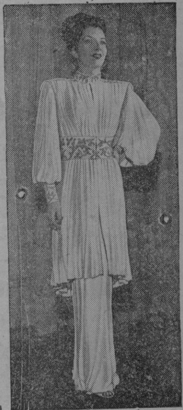
Modelo "balalaika" para recepción, confeccionado con jersey blanco, presentado en la exhibición Hotel Mayfair, de Londres (Calpe)