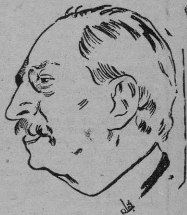
LOS PARTIDOS POLITICOS APOYARAN LA CANDIDATURA DE LEON BLUM

Los pliegos se llenaron inmediatamente de firmas de la totalidad de los Procuradores en Cortes. — Cifra.