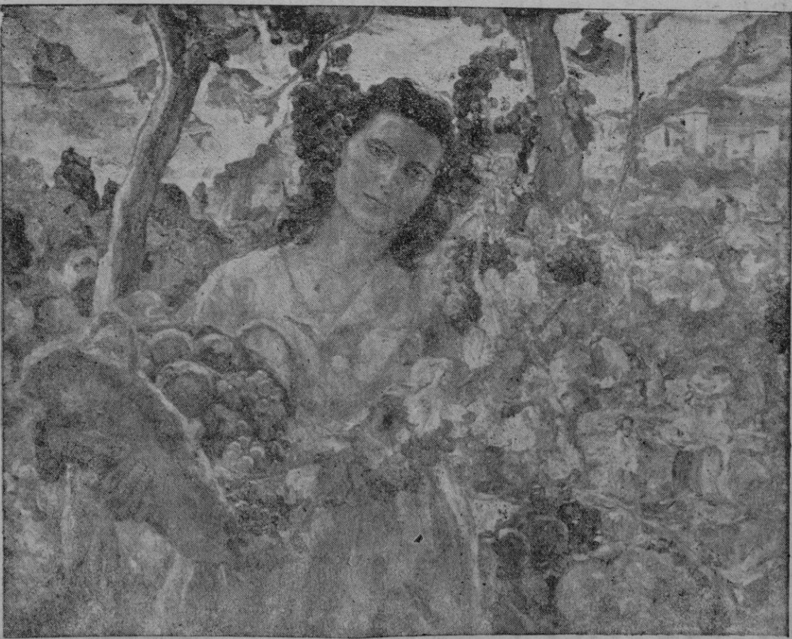
"Melodía otoñal", óleo por Alexis Mace donski

Efectuada la votación a las cinco de la tarde, Blum, que por tercera vez rige los destinos de Francia, ha salido triunfante por 575 sufragios, según recuento no definitivo. — Efe.