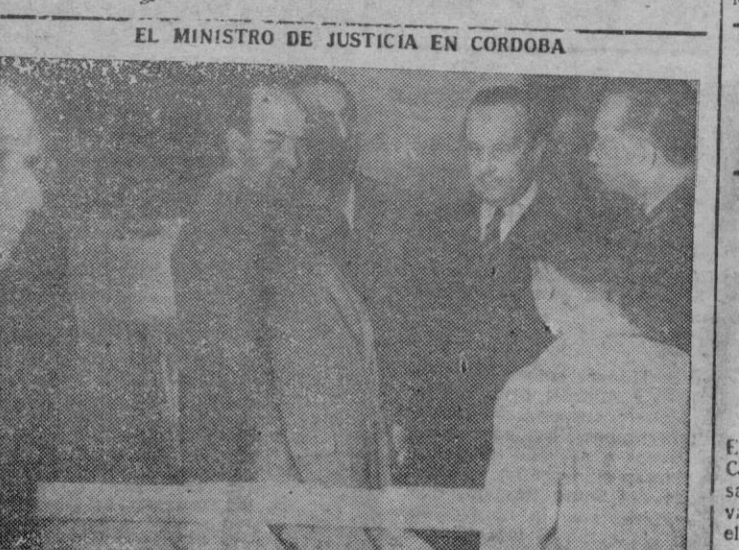
EL MINISTRO DE JUSTICIA EN CORDOBA

AL SER PREGUNTADO POR UN PERIODISTA SI ERAN CIERTOS LOS RUMORES DE QUE SE HALLABA EN ESTUDIO LA POSIBLE PARTICIPACION DE ALEMANIA EN LOS PLANES DE EUROPA OCCIDENTAL. EL SECRETARIO DE ESTADO CONTESTO CON UN SECO "NO". -- Etc.