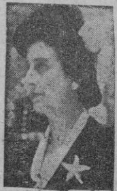
D. Carmen Polo

Oviedo 30. — La esposa de S. E. el Jefe del Estado, doña Carmen Polo de Franco, ha asistido este mediodía a la inauguración del nuevo edificio de la Cruz Roja, acompañada por las esposas del Ministro de Obras Públicas, del Gobernador Civil y de otras autoridades y personalidades.