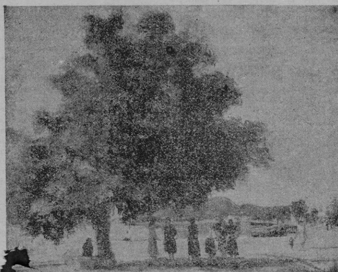
«TAMARINDO», de Guillermo Vadell

Terminar esta breve nota diremos, a manera de resumen, que Vadell ha llegado al momento de sentirse obligado a una consueperación. Ello nos faculta para, desde hoy, exigirle el rendimiento que tenemos derecho sus amigos.