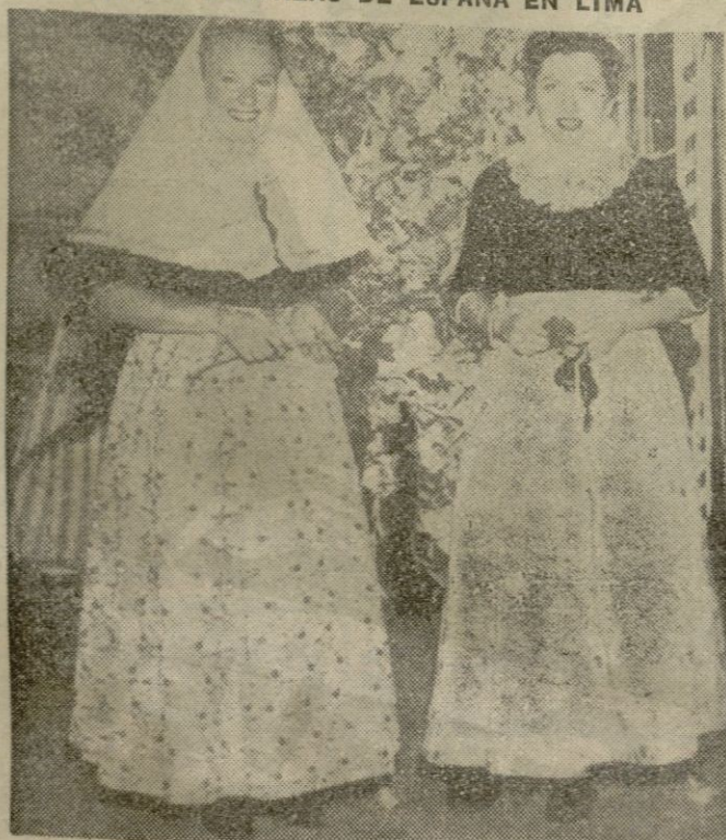
Lima. — Dos bellas muchachas mallorquinas de los Coros y Danzas, que obtienen un éxito sin precedentes en el Teatro Municipal de esta ciudad, donde actúan.