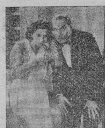
Una escena del film

(Astoria y Avenida) Una no muy nueva película americana en la que, con la colaboración de una serie de conocidos actores, se nos ofrece una comedia completamente elemental y un saco de chistes, de lo más patoso y, entre ellos, alguno de mayor gracia.