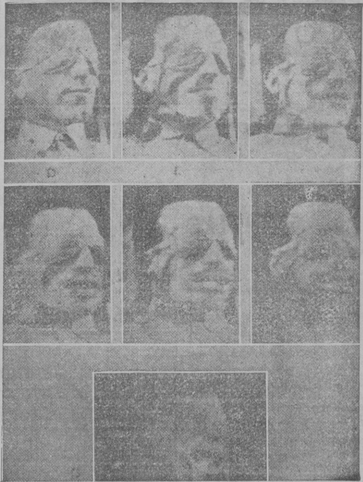
Según los experimentos realizados en el Centro de Matra, Aeronáutico de los Estados Unidos, estas son las expresiones del rostro de un piloto sometido a pruebas de altas velocidades.

La cámara ha captado estas fotografías que recogen la paulatina deshumanización de las facciones de un aviador al que una corriente de aire azota la cara al volar a trescientos, quinientos, novecientos kilómetros por hora.