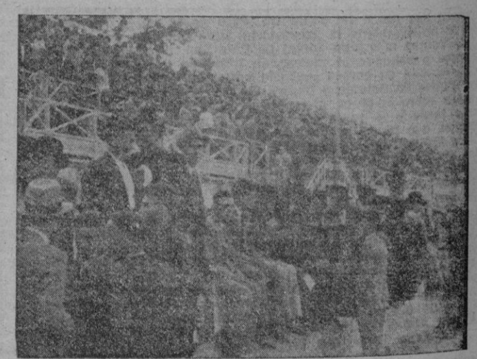
Aspecto imponente que ofrecían las tribunas del Hipódromo de la Real Sociedad Hípica de Mallorca, durante la celebración de la «Gran Diada Hípica Anual»