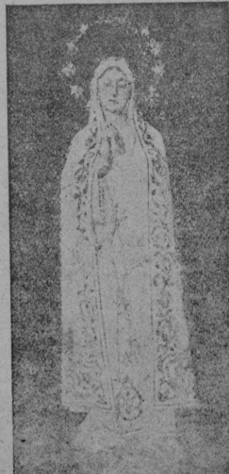
NUESTRA SRA. DE FATIMA