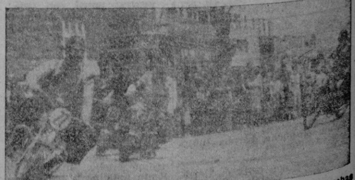
Un momento en que las motos toman un viraje, en las pruebas celebradas el domingo por la mañana en las Avenidas