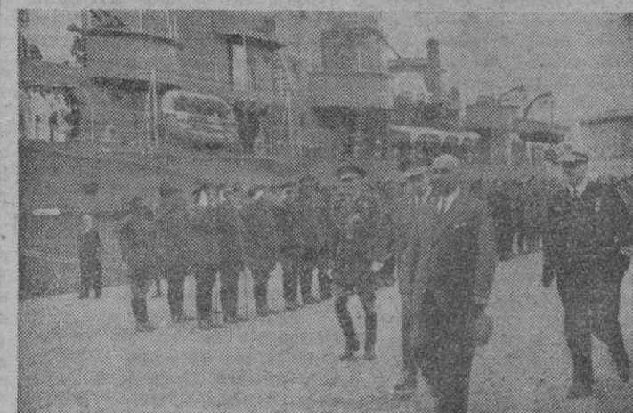
S. E. el Jefe del Estado, llega al Club Náutico para presenciar las regatas.