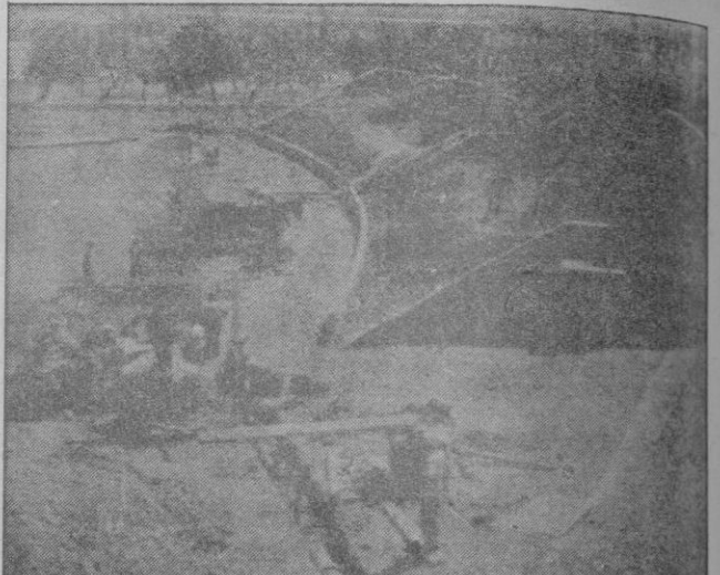
La tribuna del gol de abajo, tal como se encuentra actualmente. Se ven también en esta foto las tuberías de conducción de agua que ya circundan el campo y cuya línea traza la delimitación de los cimientos de la tribuna de sombra que ha empezado a construirse