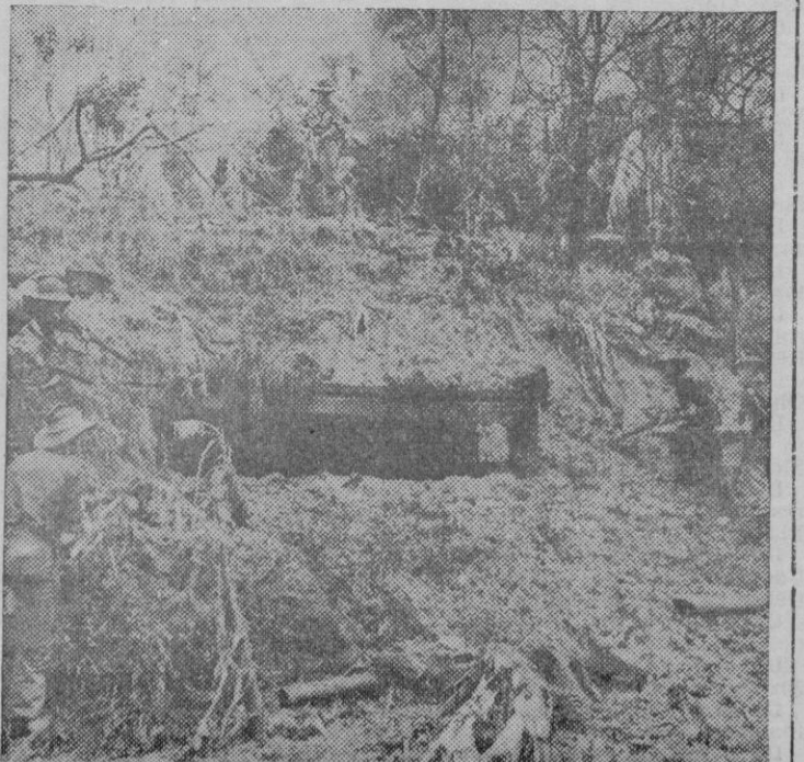
Soldados de las Fuerzas Imperiales Australianas rodean una casa-mata en el interior de la costa de Borneo