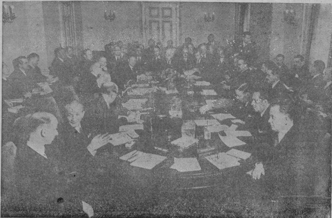
Los miembros de la Comisión Ejecutiva de la recién clausurada U. N. C. I. O., reunidos en una de las últimas sesiones