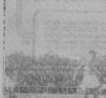
Aquí vemos a Larios deteniendo con gran estilo un tiro de la delantera constante, acosado por Ostolaza

Antolín y Corró lanzan de nuevo el balón blanco y de nuevo el poste detiene un fuerte disparo de Antolín, que se muestra el más peligroso del ataque y otro disparo de Ostolaza. El ala izquierda se muestra fallona y Primo mal servido no tiene los balones que su juego característico necesita.