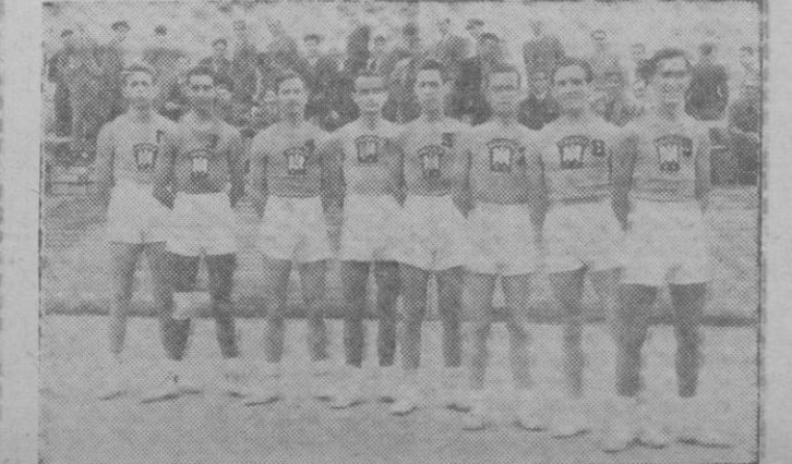
El equipo del Frente de Juventudes de Valencia, que el domingo venció al Palma por 21-16

dable resultado logrado en Valenci- cia, era de esperar que aquí, ante su propios seguidores, volvería a lograr la victoria y en forma que no hubiese lugar a dudas, pero no fué así; perdió el partido porque jugó menos que los valen- cianos, a pesar de que estos tam- poco hicieron nada para conseguir el triunfo, si bien superaron en algo a los de casa en velocidad y entusiasmo.