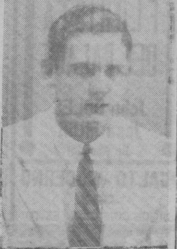
LEZA Entre los amalos el mejor

Ayer salió a la pista del Agua Dulce un equipo que solo llevaba