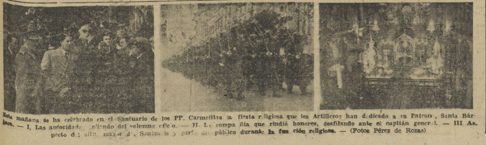
Esta mañana se ha celebrado en el Santuario de los PP. Carmelitas la fiesta religiosa que los Artilleros han dedicado a su Patrona, Santa Bárbara. — I. Las autoridades, al inicio del solemne oficio. — II. La compañía que rindió honores, desfilando ante el capitán general. — III. Asunto durante la función religiosa. — (Fotos Pérez de Rozas)