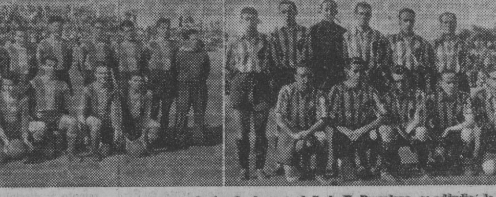
El equipo del Barreda Balompí, que al vencer en la tarde de ayer al C. de F. Barcelona, se adjudicó la Copa de S. E. el Generalísimo de Aficionados. El laureadísimo general Moscardó, hace entrega del trofeo al capitán del equipo montañés.