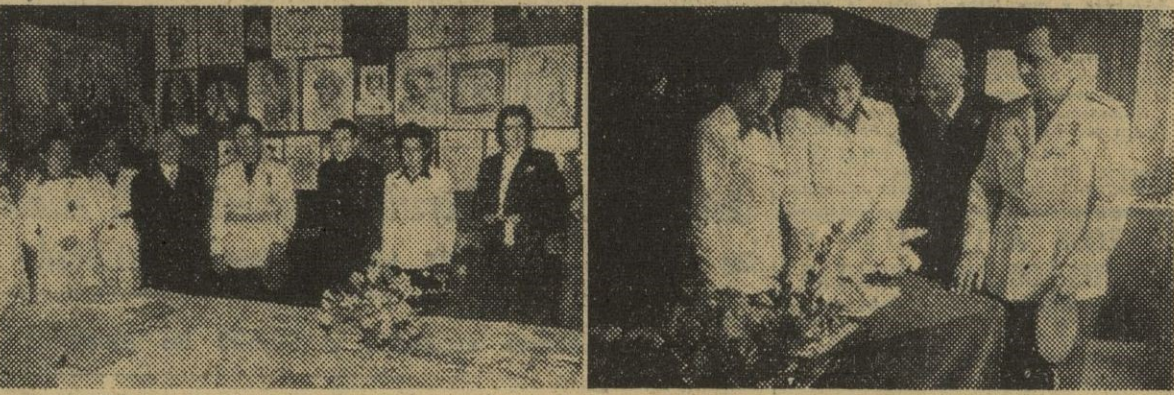
Ayer se celebró la fiesta de fin de curso en la Institución de Cultura para la Mujer...

Fin de curso, en la Institución de Cultura para la Mujer