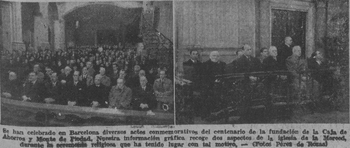
Se han celebrado en Barcelona diversos actos conmemorativos del centenario de la fundación de la Caja de Ahorros y Monte de Piedad. Nuestra información gráfica recoge dos aspectos de la Iglesia de la Merced, durante la ceremonia religiosa que ha tenido lugar con tal motivo.