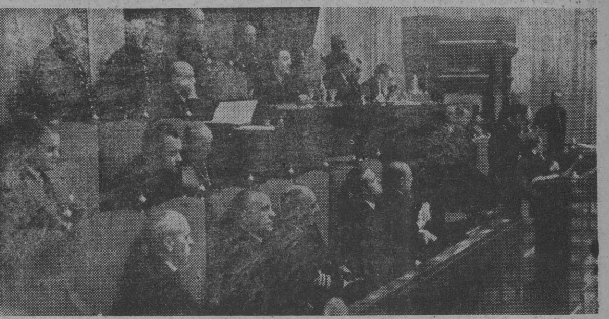
Se reúne el Pleno de las Cortes Españolas y juran sus cargos los nuevos procuradores.