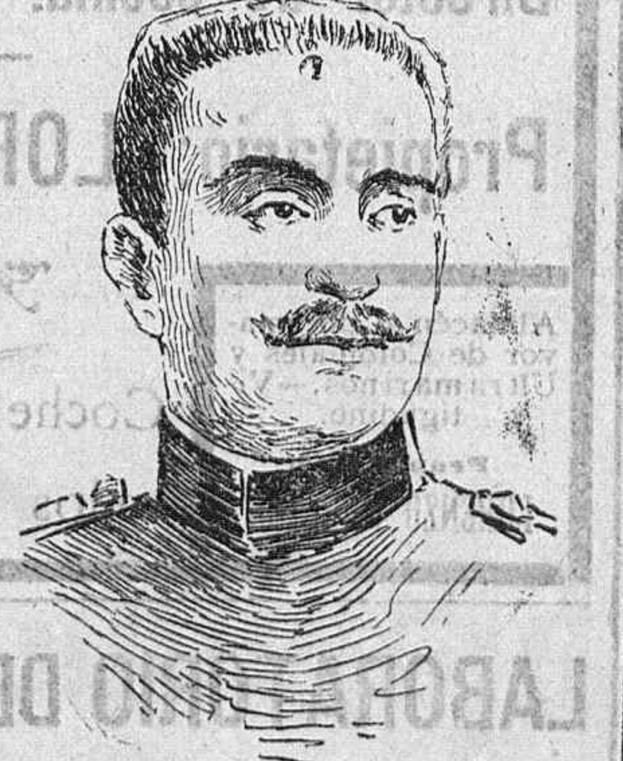
General Illesco, jefe de Estado mayor rumano. cipe heredero de Baviera; pues sus fuerzas resultan insuficientes para contener la ofensiva aliada en el Somme. Como el 6nico frente de donde los alemanes pudieran distraer soldados es el de Verd6n, donde ahora reina relativa calma, y el Kronprinz no es partidario de disminuir las fuerzas sitiadoras de la poderosa fortaleza, no es aventurado vaticinar que el avance franco-ingles en la regi6n del Somme continuar6 en mayor proporci6n que hasta ahora. Hay que tener en cuenta, para apre-