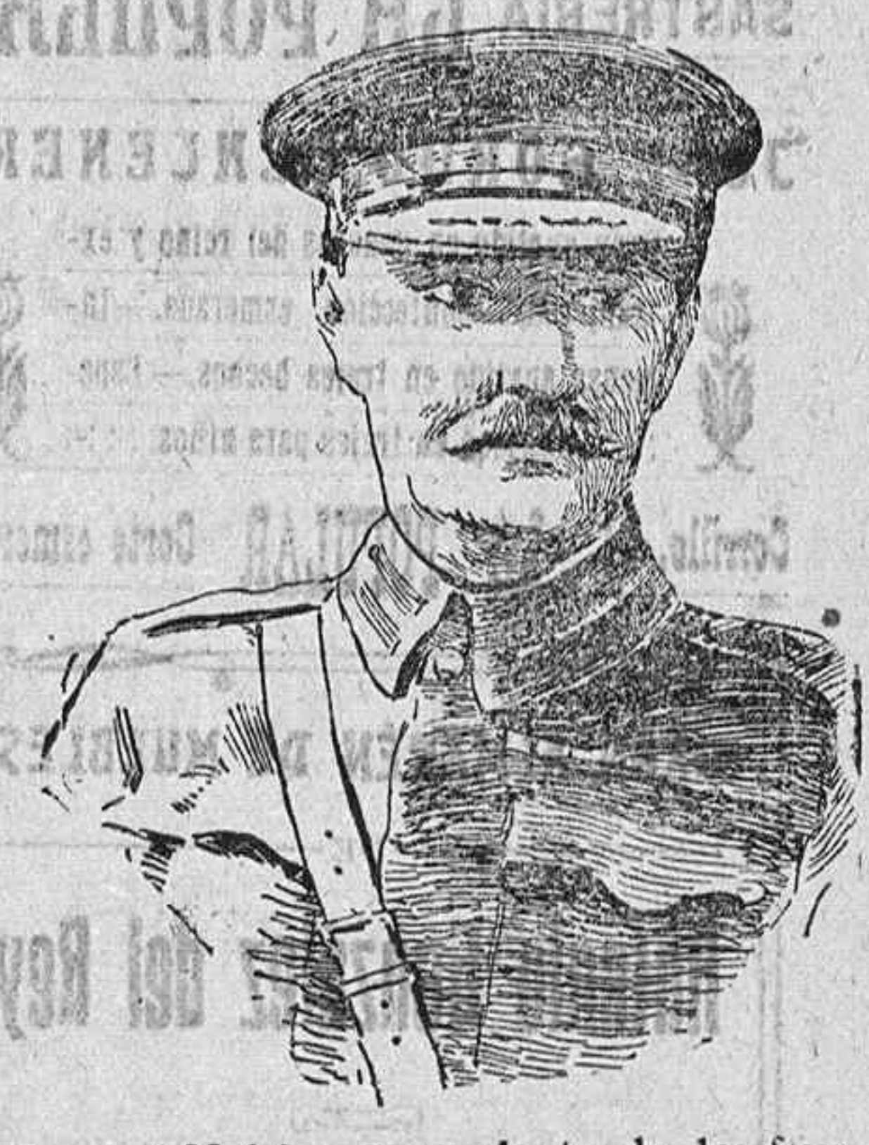
General Mah6n, comandante de las fuerzas inglesas, en el frente balk6nico. parece preocupar mucho a los rumanos, toda vez que, lejos de concentrar a las fuerzas que se opongan al avance de las tropas del Zar Fernando, prosiguen la marcha por la Transilvania, acaso siguiendo un plan trazado de acuerdo con los rusos, para iniciar un ataque definitivo contra Hungrfa, antes de que el invierno paralice la acci6n del moscovita.

La informaci6n telegr6fica. Ve6ase en 6ltima plana. Gutierrez. De seis y cuarto a ocho y cinco y cinco. Discurso inaugural. La oraci6n inaugural del curso acad6mico la pronunci6 el delegado regio-nal de Turismo y querido amigo nuestro, don Andr6s P. Cardenal.