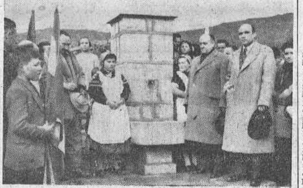
En el pueblecito serrano de Cincovillas se verificó ayer el acto de inauguración del servicio de abastecimiento de aguas, al que asistió el presidente de la Diputación de Madrid, marqués de la Valdivia.

Hasta ahora, los vecinos habían de desplazarse a cinco kilómetros fuera del pueblo