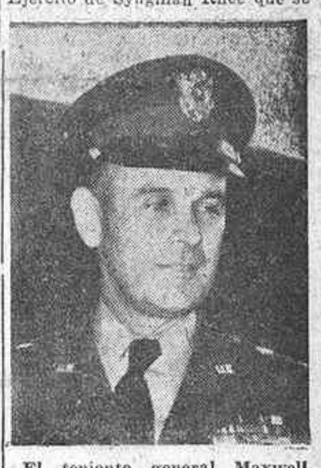
El teniente general Maxwell Taylor, que ha sido nombrado nuevo comandante en jefe del octavo ejército en Corea, en sustitución del general James Van Fleet.

SEUL, 25.—El general James Van Fleet se ha despedido de los periodistas en una conferencia de prensa y ha manifestado que el comunismo es el 'enemigo del mundo' y ha pedido a los miembros de las Naciones Unidas que contribuyan con más hombres a la lucha de Corea. Próximo a retirarse, el hasta ahora comandante en jefe del octavo ejército, indicó que le gustaría permanecer al mando de esta gran unidad si los aliados lanzaran una gran ofensiva. Van Fleet alabó extraordinariamente a las unidades surcoreanas, a las que calificó de ser 'su mejor timbre de gloria y su mejor realización'.—EFE. Campaña comunista TOKIO, 25.—La radio comunista de Pyongyang ha redobrado su campaña para animar a las tropas aliadas a que deserten, pasando a las filas de los nortecoreanos. Esta nueva campaña ha seguido al anuncio hecho por el mando aliado de que 86 soldados y un oficial habían sido condenados por su mal comportamiento durante los combates en el pasado mes de octubre. La comisión roja citada dice que los desertores serán objeto de un tratamiento especial de simpatía. Añade que todos los miembros del Ejército de Syngman Rhee que se