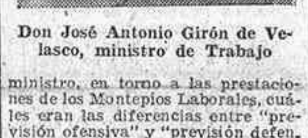
Don José Antonio Girón de Velasco, ministro de Trabajo

El ministro de Trabajo, don José Antonio Girón de Velasco, hizo anoche ante los micrófonos de Radio Nacional unas importantes declaraciones, en las que amplió algunos extremos de las hechas con anterioridad al director de 'Arriba', y que fueron publicadas por nuestro querido colega en la mañana de ayer. Al ser preguntado el