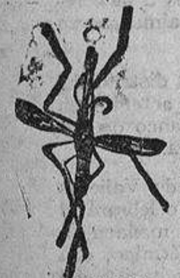
ANOFELE Mosquito que propaga la fiebre palúdica.