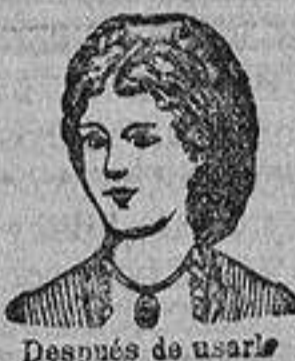
Después de usarlo

SE VENDE EN MADRID EN LAS PERFUMERÍAS DE