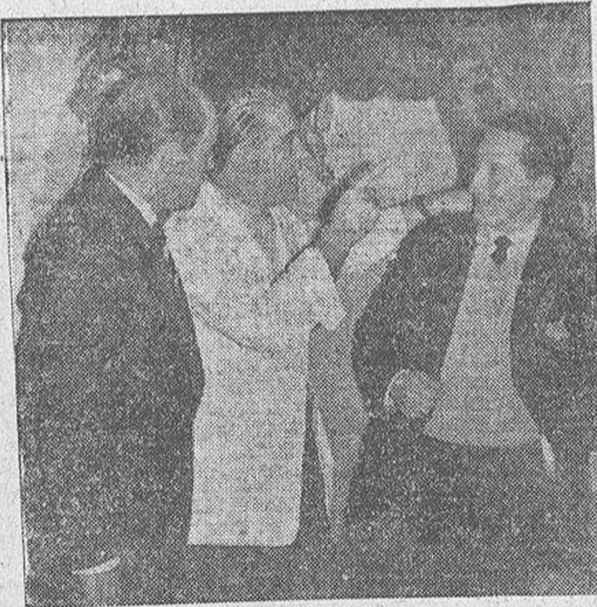
Las casquillas de alamares fue sustituida por la blanca chaqueta hostelera. Ese indice en alto apunta a una fecha: la de su gran apoteosis madrileña traducida en recuerdo por esa cabeza de toro al que le faltan las dos orejas, premio y balance de su inicial triunfo

El cuarto novillo de la tarde —un colmenareño de Vicente Puente— arrollaba con la fuerza de un huracán cuantos obstáculos se le ponían por delante. Sus pitones se agaban como cuchillas los capotes de brega. Un torero, recientemente descubierto y aclamado por la ortica y público de Madrid, debutaba ante los coruñeses. En el almanaque una fecha: 13 de agosto de 1933. Aquel era su toro y también aquella su tragedia, porque un vitón del colmenareño lo ensartó y tremolante, cual bandera de dolor y de derrota, cruzaba el ruedo de nuestra plaza.