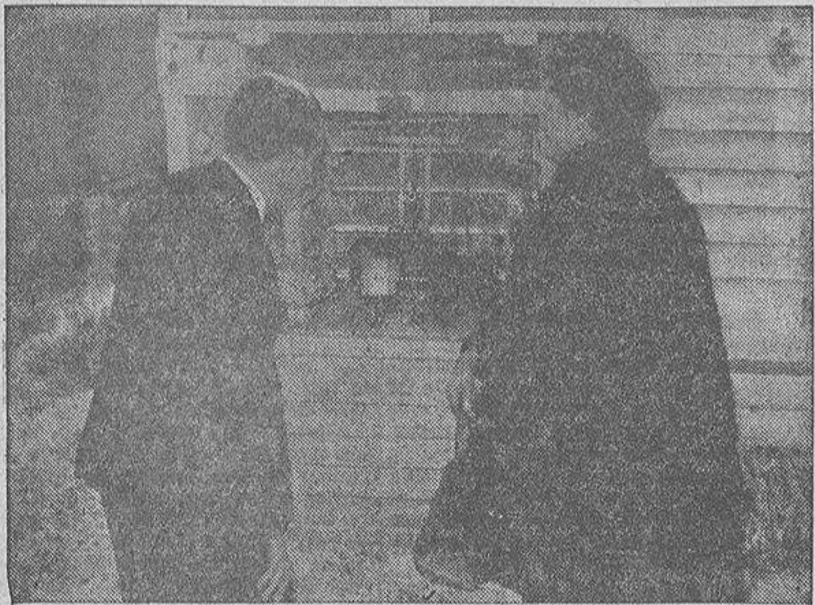
Uno de los empleados del observatorio comprueba la temperatura del día.

En la día inicial, en esos pasados días en que apretaba el frío en casi todo el mundo, llegaron a La Orotava unas ráfagas del gélido elemento invernal, y los ciudadanos marineros, habituados a su suave y tibio clima recibieron el glacial mensaje en tal forma que hasta, caso insólito, nuestras frecuentadas calles aparecían barridas de gente, que se apresuraba a acogerse a sus confortables hogares.