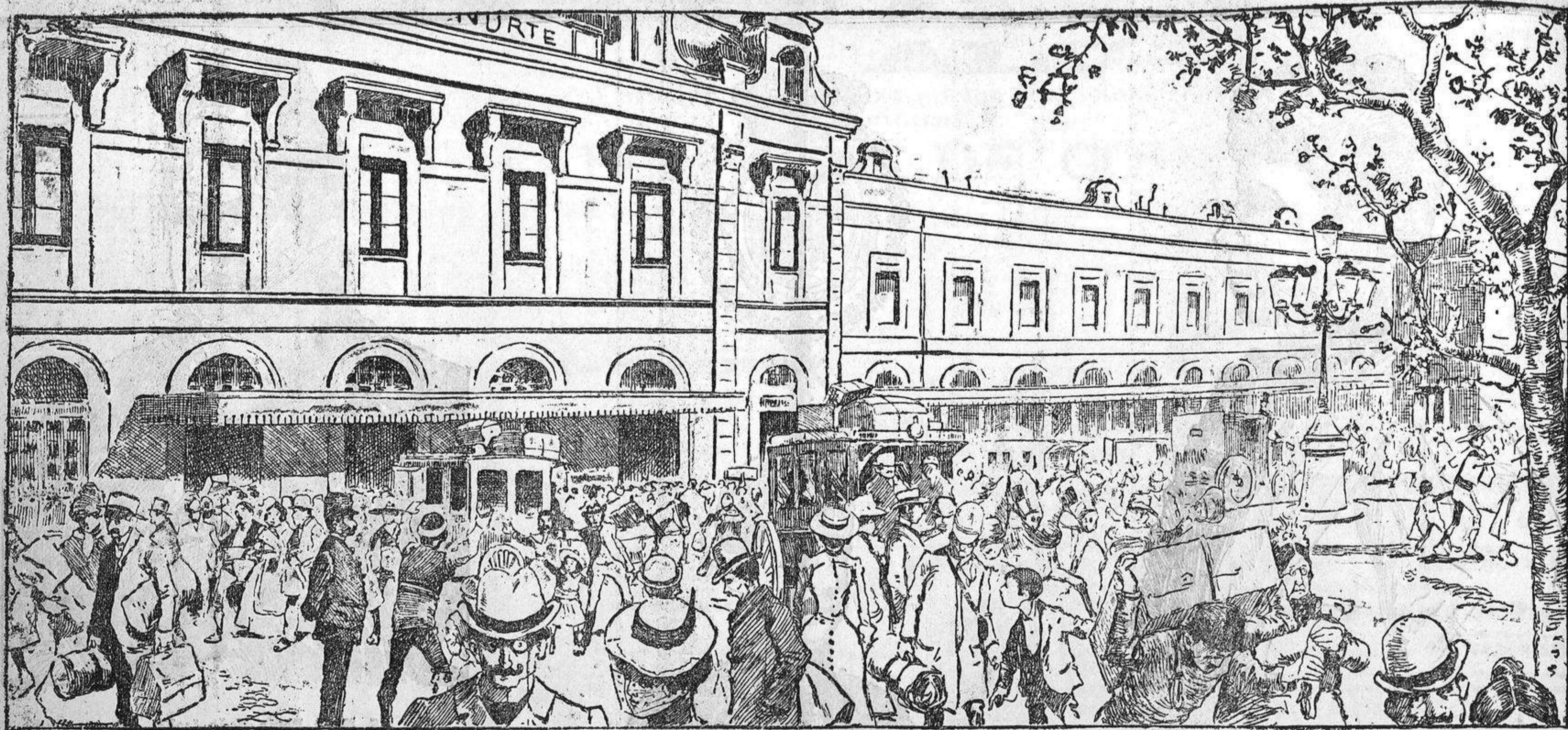
Estación del ferrocarril del Norte.