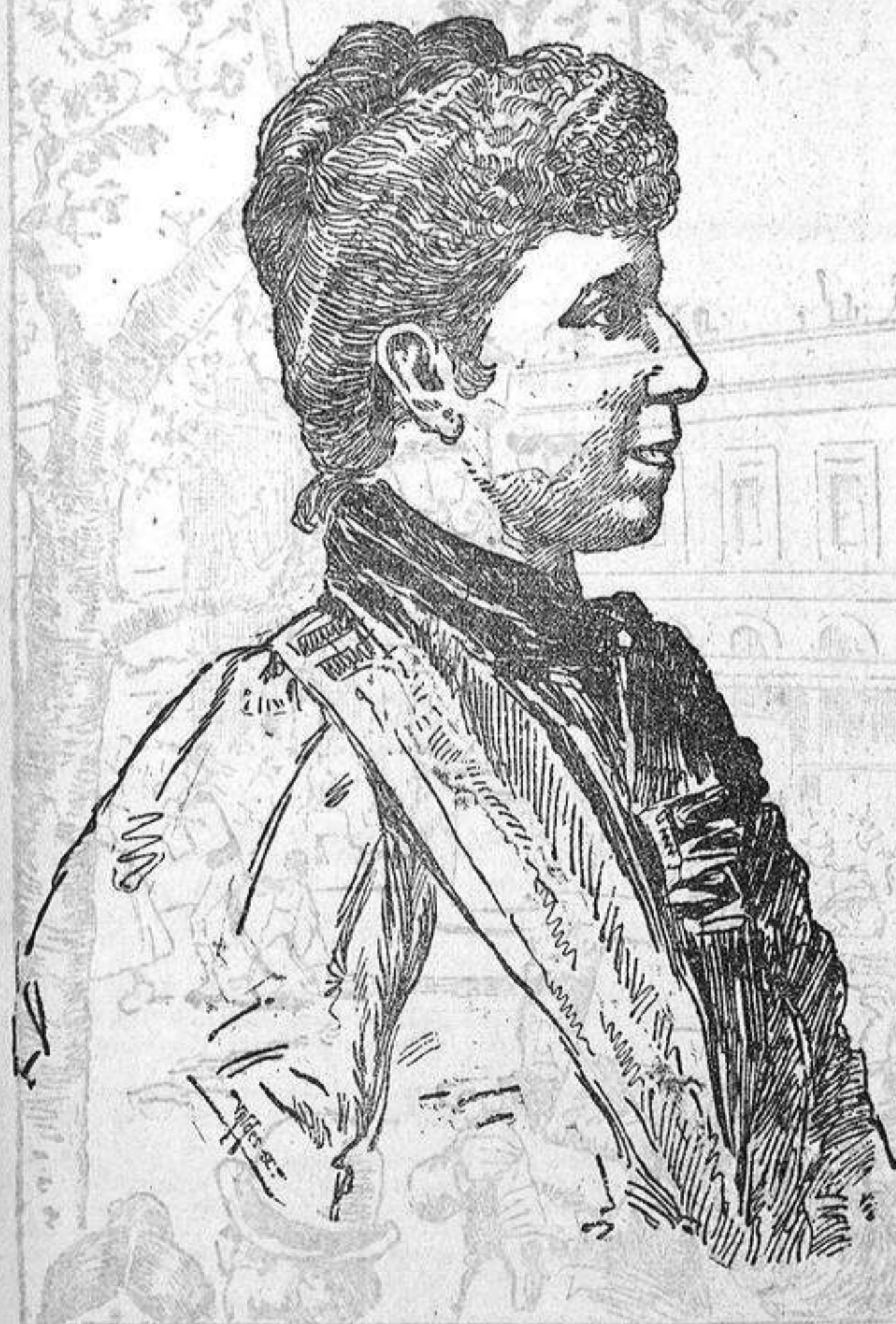
S. M. la Reina Regente.