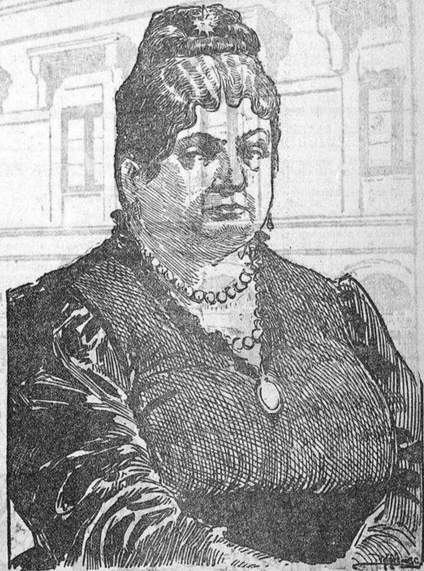
S. M. la Reina Doña Isabel II.