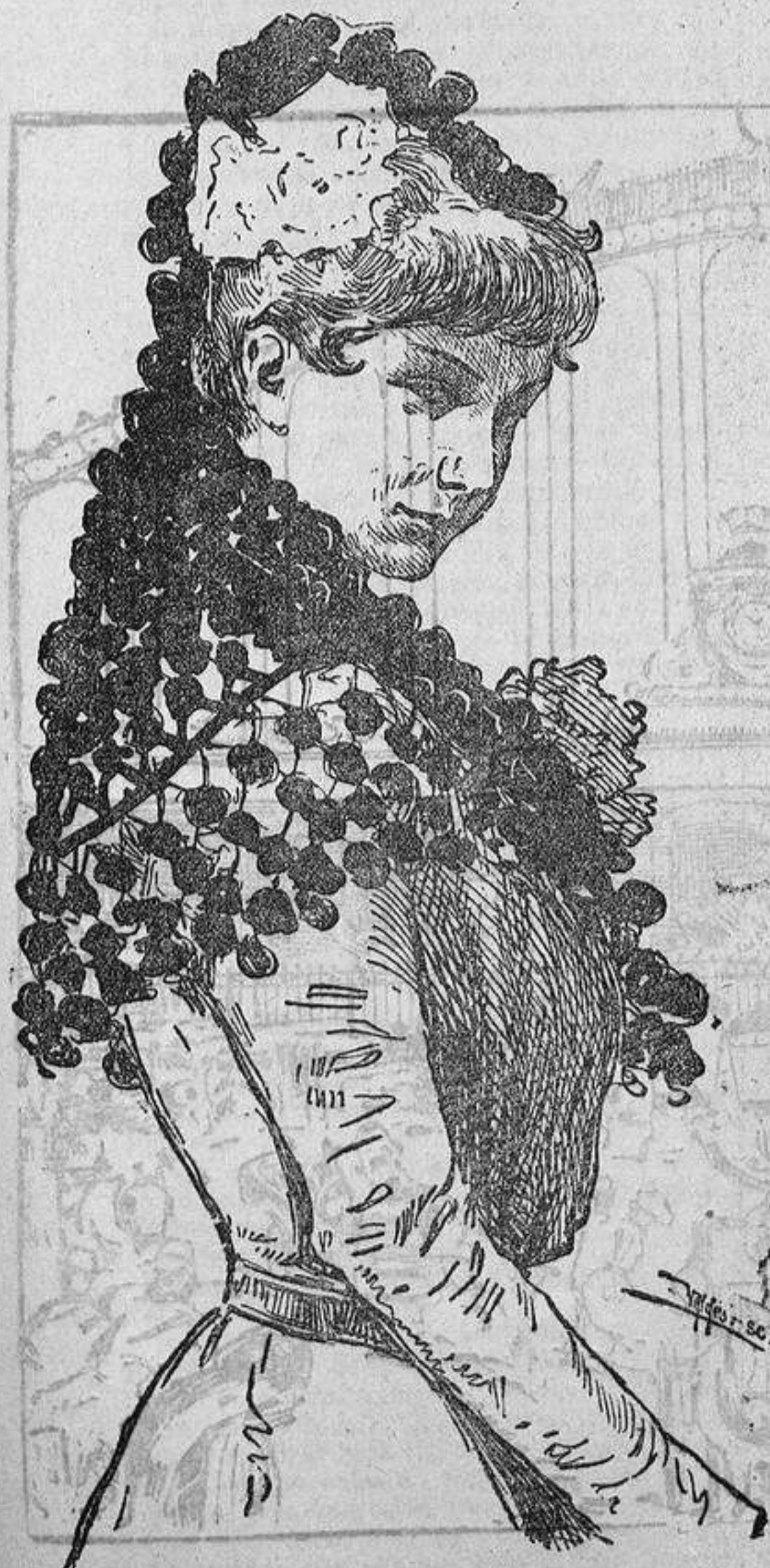
S. A. la Infanta Doña Eulalia.