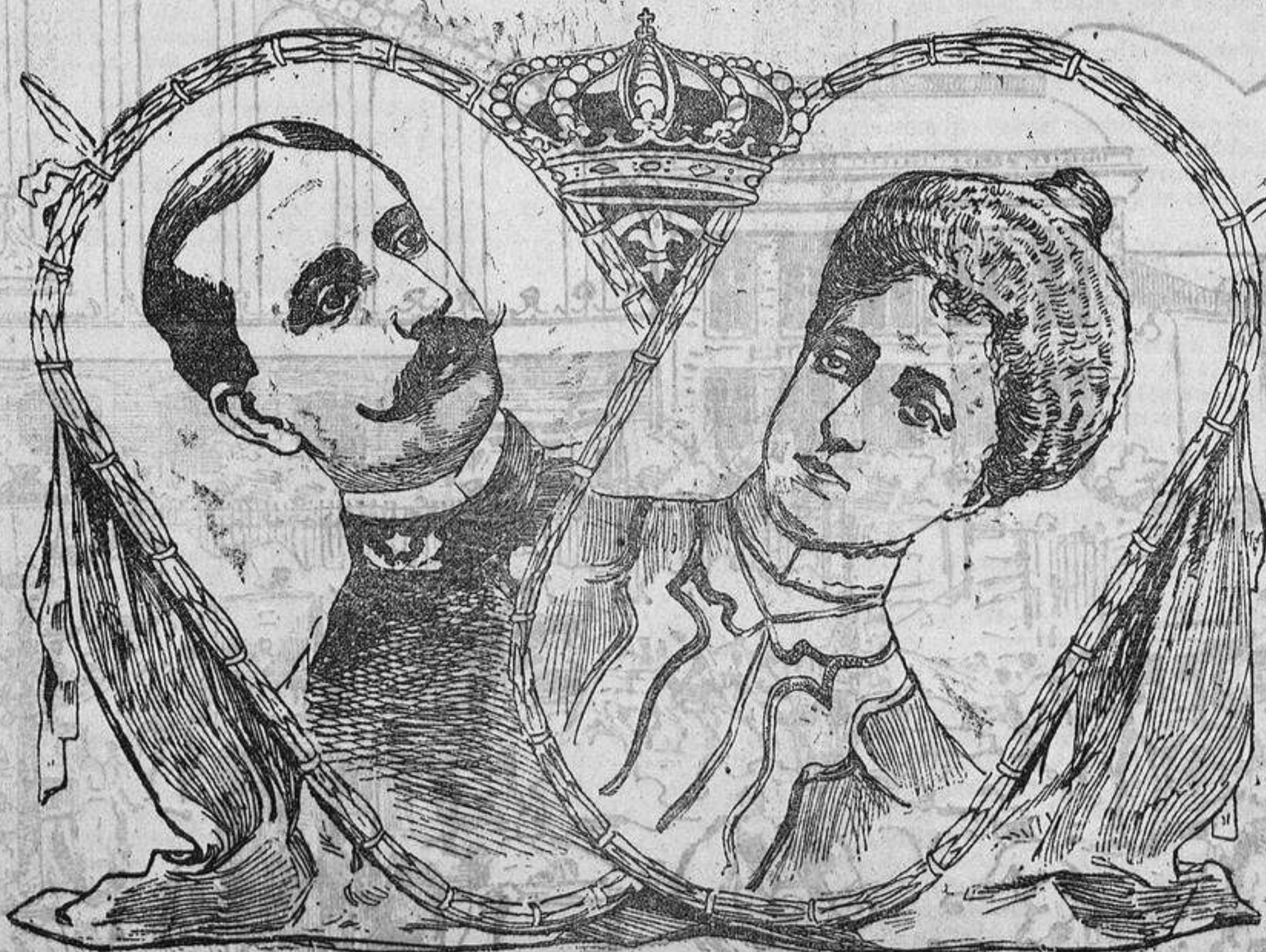
SS. AA. RR. los Príncipes de Asturias.