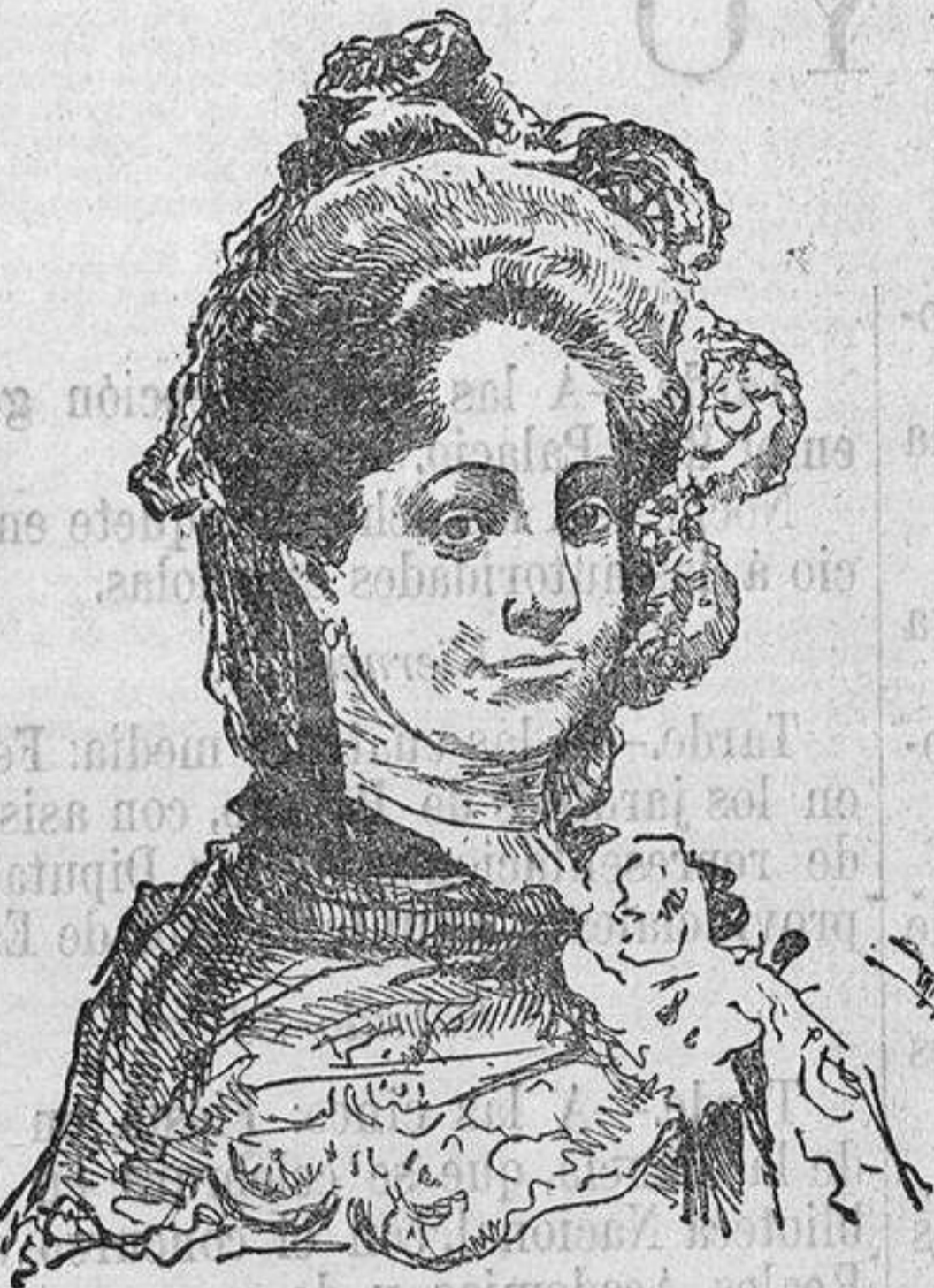
S. A. la Infanta Doña Maria Teresa.