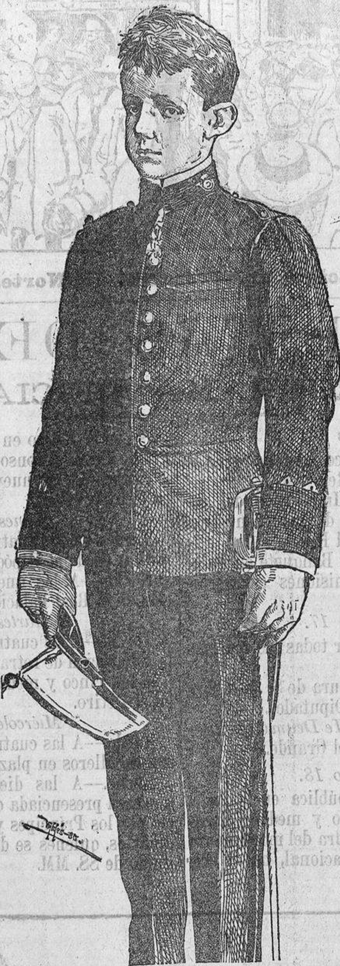
S. M. el Rey D. Alfonso XIII.