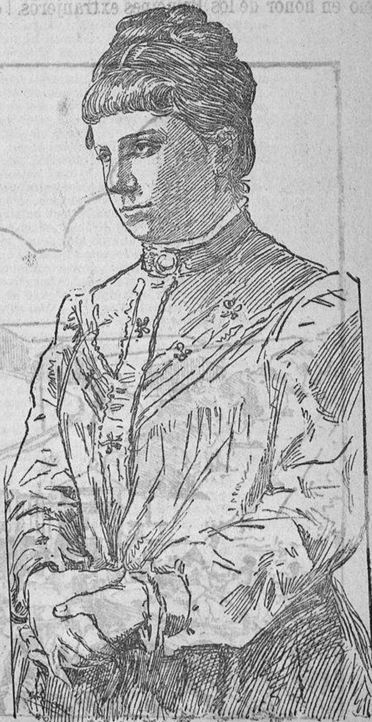
S. A. la Infanta Doña Paz.