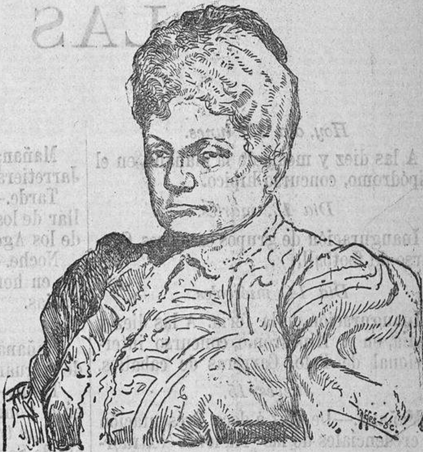
S. A. la Infanta Doña Isabel.