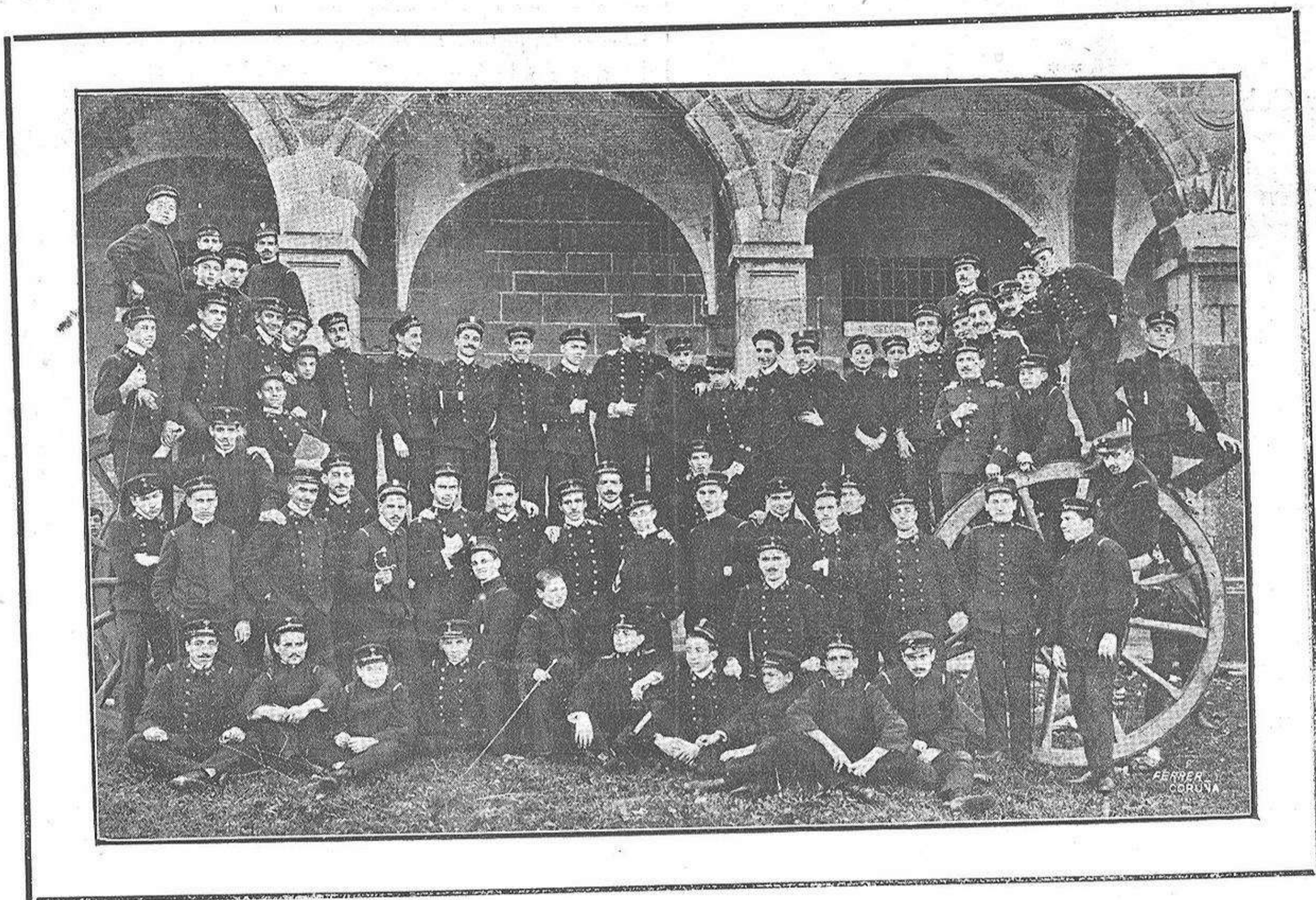
FERROL. LOS ALUMNOS DE LA ESCUELA NAVAL

De nuestro Corresponsal artístico D. Pascual Rey