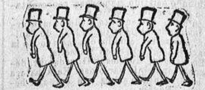
La candidatura por Madrid.