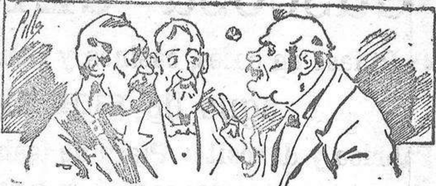
Abominan á nuestros libros..... pero los compran.

Todas las personas de gusto, curiosas é ilustradas deben pedir al Director de LA AVISPA, apartado núm. 8, MADRID, un ejemplar que se remite gratis y franqueado. Esta Revista Enciclopédica Popular publica recreaciones científicas, recetas de cocina, repostería, confitería, vinos, licores, pinturas, barnices, betunes y fórmulas para toda clase de industria, y cuantas noticias y conocimientos puedan ser beneficiosos. Cuenta además con buenos grabados, parte literaria excelente; da regalos mensuales á sus lectores con la Lotería Nacional y participaciones en la misma, á cuyo efecto compra todos los sorteos, y en una de las Administraciones más afortunadas por la suerte, billetes enteros. La suscripción y los números que se nos pidan se sirven gratuitamente á correo vuelto y franqueados, con sólo indicar el nombre y dirección del que lo desea en sobre dirigido al Sr. Administrador de