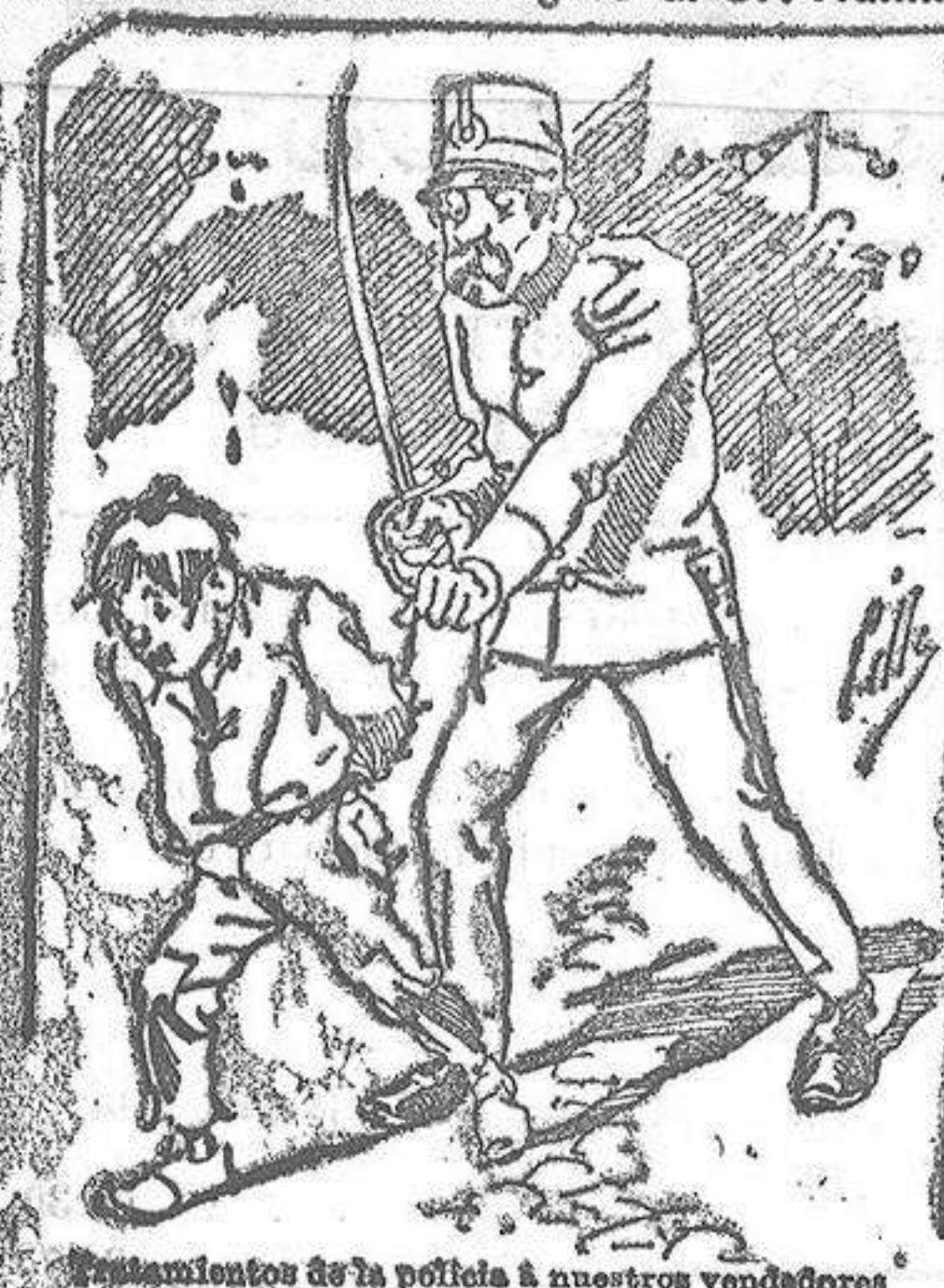
Entrevista de la policía á nuestros vendedores cuando el número pica.....

También puede pedirse LA AVISPA y el CATALOGO RESERVADO en casa de nuestros corresponsales autorizados, el que se quiere escribir á la Administración.