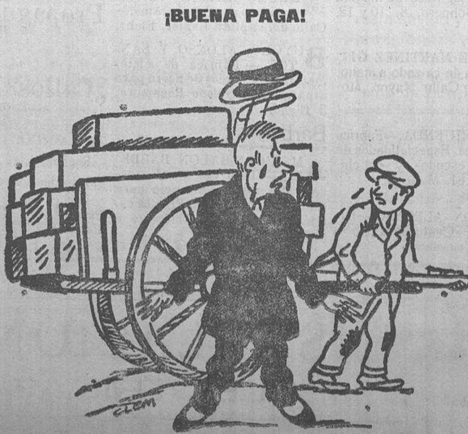
El señor (que ha ayudado a llevar el carro).—Pero, ¿no sabe tu amo lo que pesa esto para que lo lleves tú solo? —Si señor, pero me dijo que en la calle encontraría a algún imbécil que me ayudara a arrastrarlo.

Ex-Ayudante del Profesor TAPIA CONSULTA DE 11 A 1 — PLAZA DEL ABAD PENALVA, 1 FRENTE A SAN NICOLAS