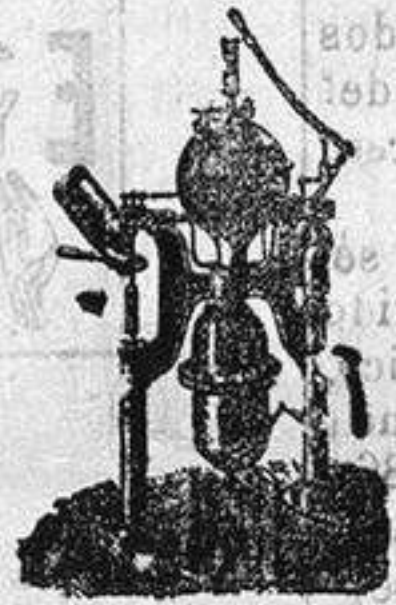
Máquina para hacer gaseosas