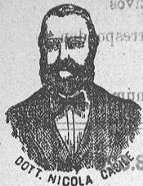
Invencible de los renombrados medicamentos CASILE