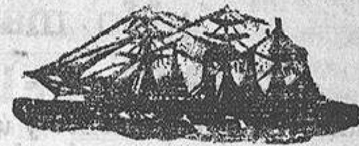
El vapor AGNES

Ginebra en tarros y damajuanas, marcas Caballo y Campana.