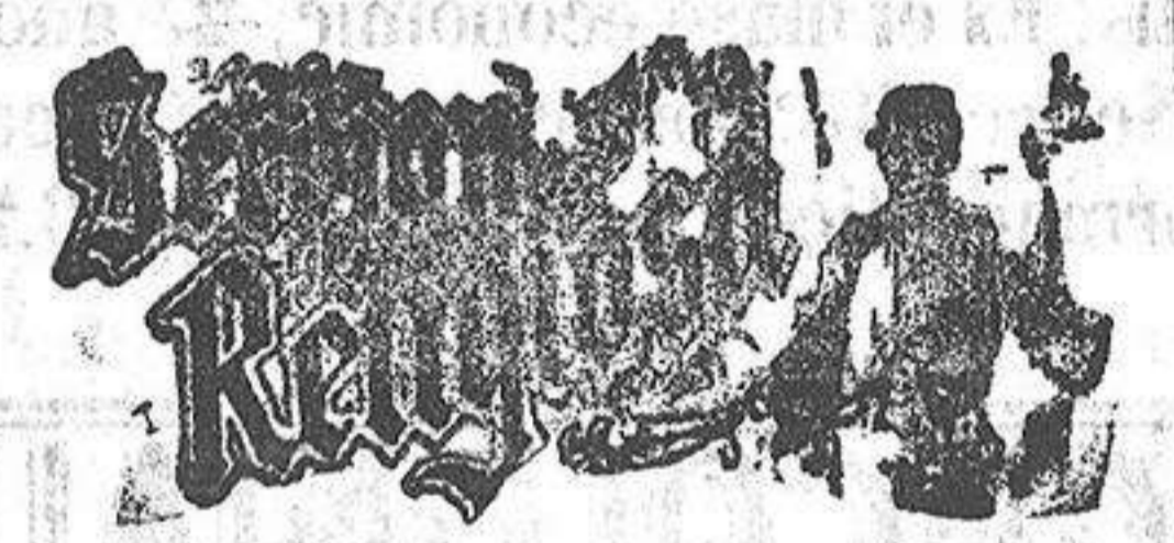
Santo de hoy: Santa Cristina. Santo de mañana: Santiago

Han dado principio los populares «Viernes» y «Sábado», con saldos, retales y gangas á la cuarta parte de su valor.