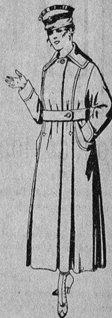
Abrigos de cheviot o gamuza, en azul, negro y colores, de ptas. 45 a 55.