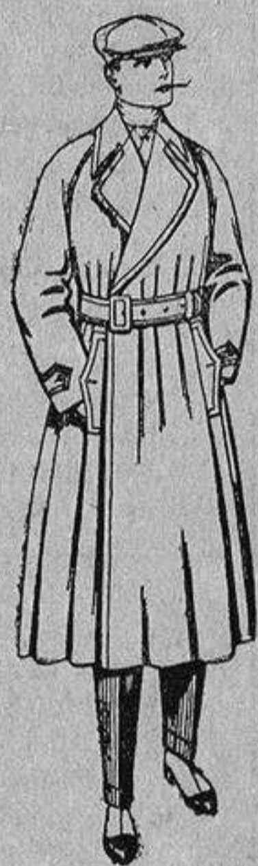
Gabanes impermeabilizados, con cinturón, color beige, de ptas. 48 a 115.