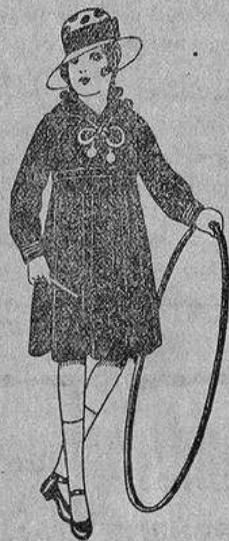
Vestidos marinera, de sarga o estambre azul, adornos seda blancos, de ptas. 25 a 30.