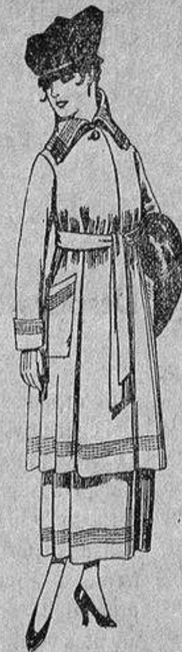
Trajes de sarga inglesa, en negro y azul, bordados, de ptas. 85 a 100.

Madrid, Barcelona, Alicante, Almería, Bilbao, Cádiz, Cartagena, Gijón, Granada, Málaga, Palma de Mallorca, Santander, Sevilla, Valencia, Valladolid y Zaragoza.