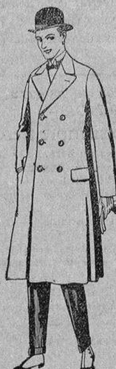
Gabanes de patén gamuza o Cover, de pesetas 50 a 110.