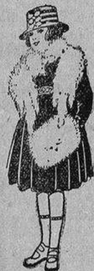
Juegos imitación Renard, blanco, a ptas. 12.