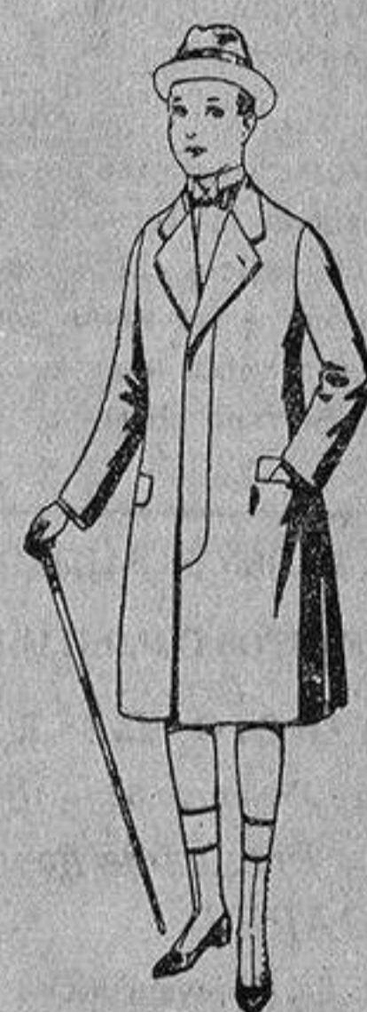
Gabanes de patén para niños de 10 de a 12 años, de ptas. 18 a 55. Los mismos, para jovencitos de 13 a 16 años de ptas. 21 a 58.

- PRECIO FIJO - VENTAS AL CONTADO - Pídase el Catálogo general -