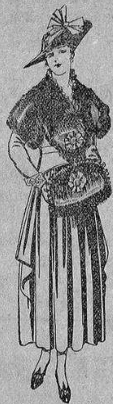
Juegos de pieles, negro, imitación Renard. Gran chic, a ptas. 58.