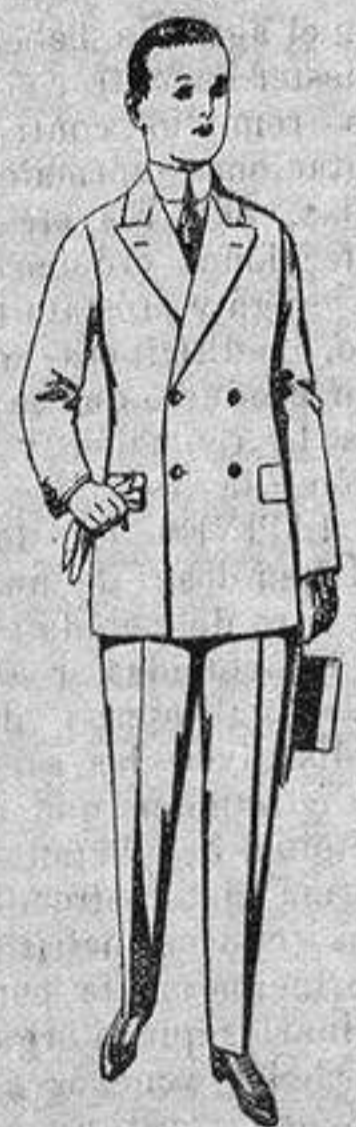
Traje de estambre, vicuña o jerga para jovencitos de 10 a 16 años. de ptas. 19 a 50