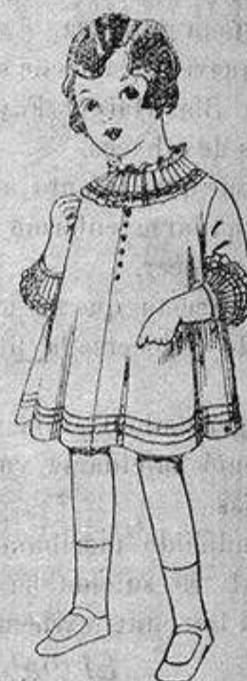
Vestido de voile blanco bordado. De ptas. 6'75 a 8