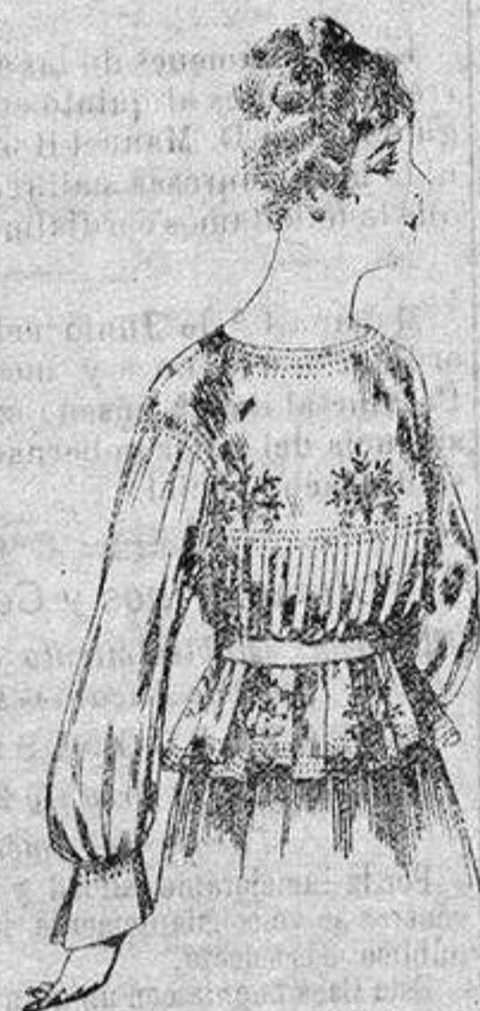
Blusa de crespón o seda, en negro, azul y color. de ptas. 33 a 35

Ropas confeccionadas para Caballero Señora, Niño y Niña