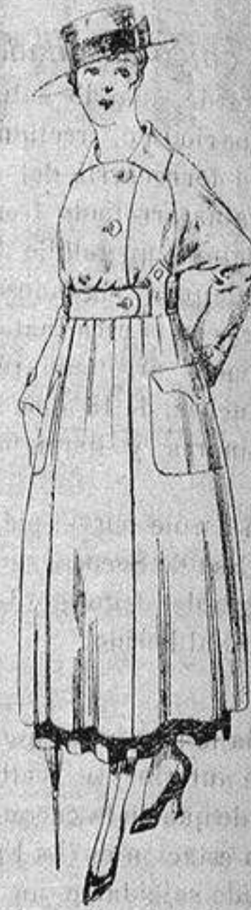
Guardapolvo de dril beige manga Ragland. a ptas. 23