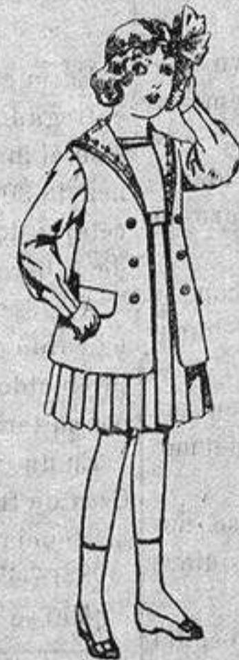
Traje de gabardina blanco, cuello de organdín bordado, para niñas de 4 a 9 años. De ptas. 22 a 24