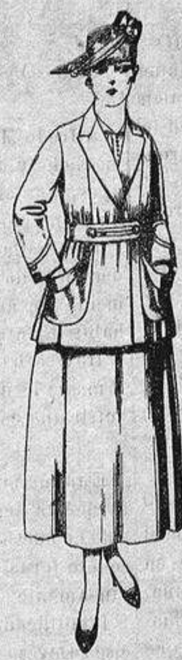
Traje de estambre negro, azul y color. de ptas. 70 a 75