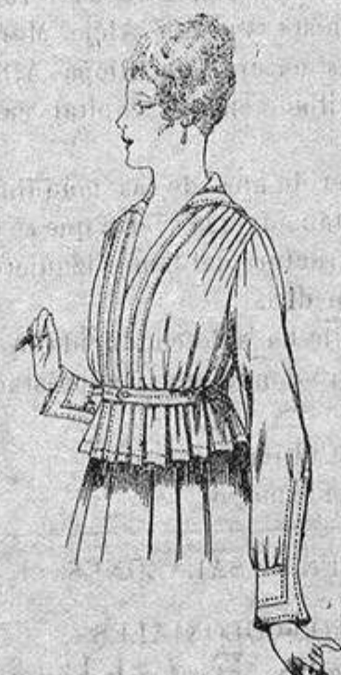
Blusa batista blanca A ptas. 5'75

Camisería, Géneros de Punto, Corbatería, Guantería, Sombrerería, Zapatería, Bastones, Paraguas y Artículos de Viaje