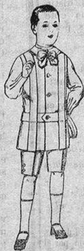
Traje de lanilla, para niños de 4 a 9 años. de ptas. 12 a 31