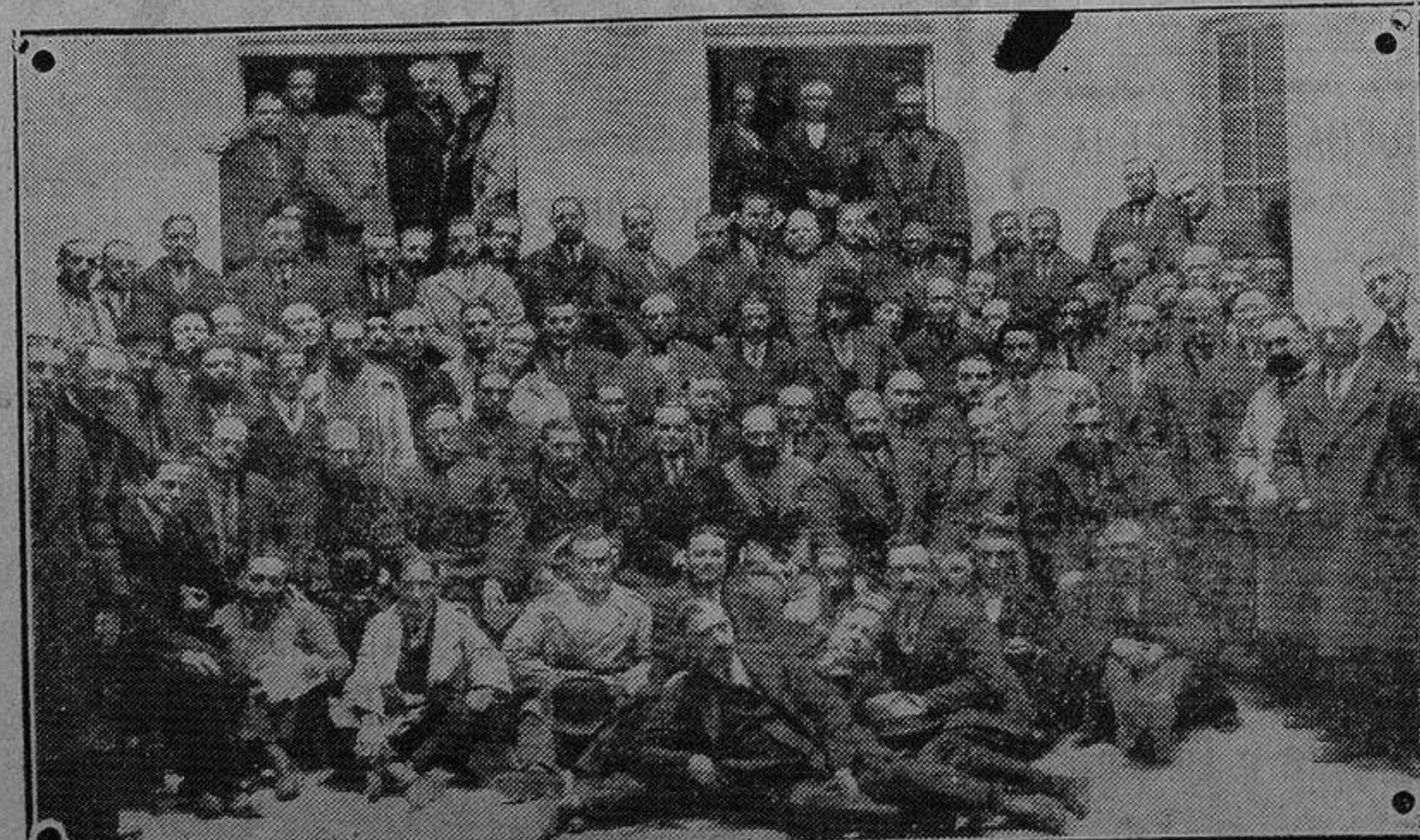
Delegados de los Sindicatos Católicos obreros que celebraron una Asamblea en la corte.