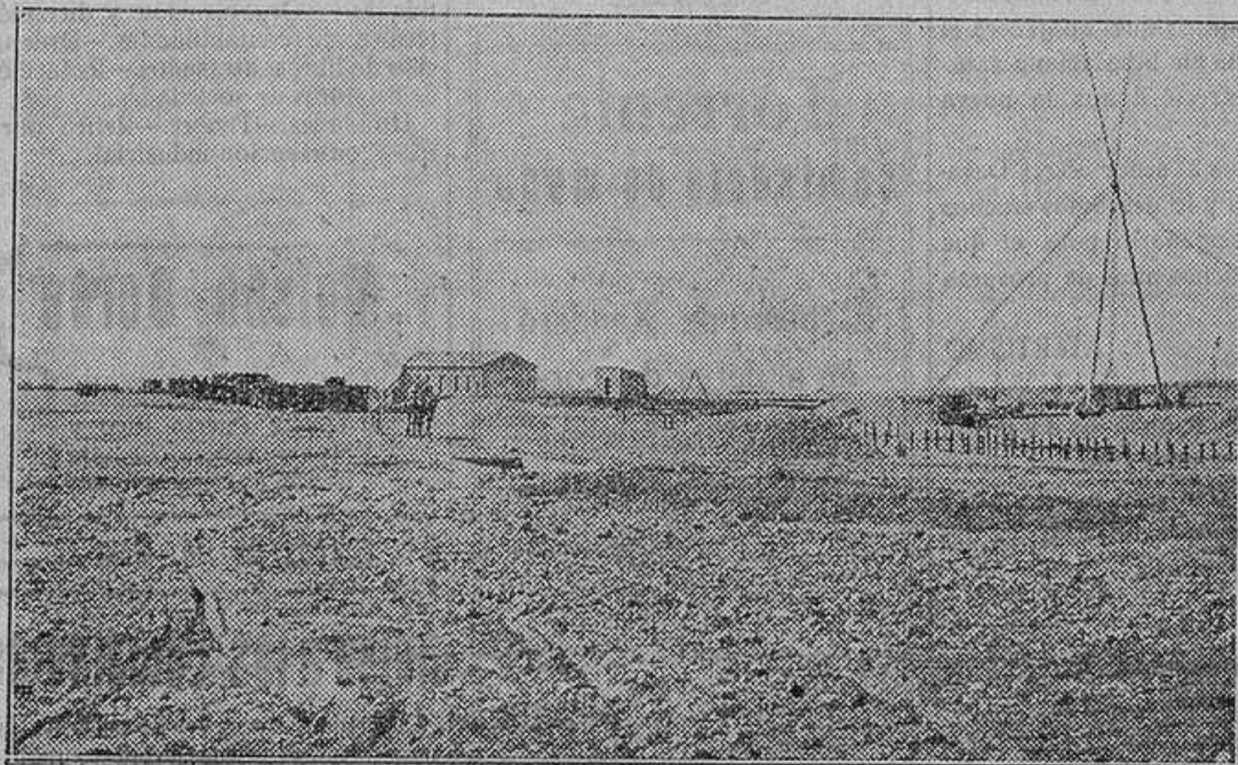
Una vasta extensión pelada de toda siembra e inproductiva se adquiere para emplazamiento de la fábrica

una tierra hostil a todo, un templo nuevo de trabajo que es riqueza, que es pan y bienestar para núcleo no pequeño de la comarca.