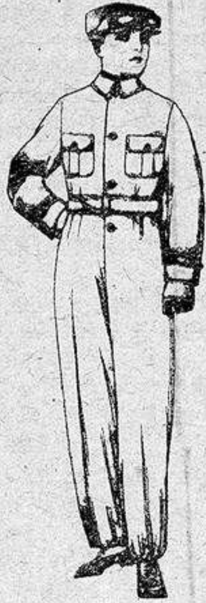
Trajes de dril azul, beige, kaki, etc., para aviador, motociclista, mecánico, etc., de ptas 18 a 25.

Ropas confeccionadas para Caballero, Señora, Niño y Niña