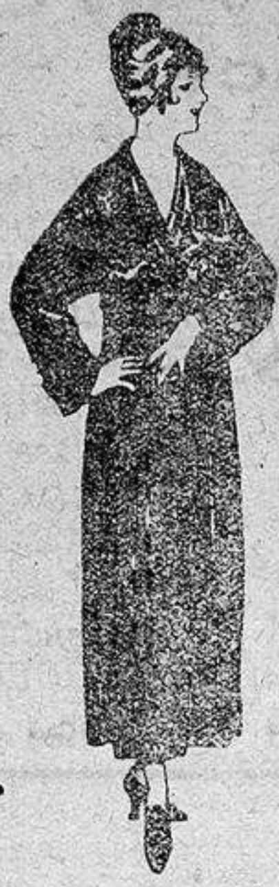
Batas de crepón, esterilla, etc., de ptas 32 a 46.