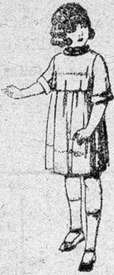
Vestidos de seda liberty, pongée, etc., para niñas de 7 a 12 años, de pesetas 30 a 38.