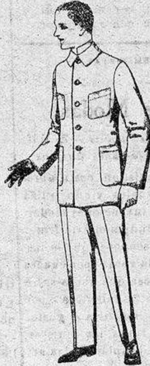
Trajes de dril azul, para mecánicos, de ptas. 17 a 25.

Camisería, Géneros de punto, Gorbatería, Guantería, Sombrerería, Zapatería, Paraguas, Bastones y artículos de viaje