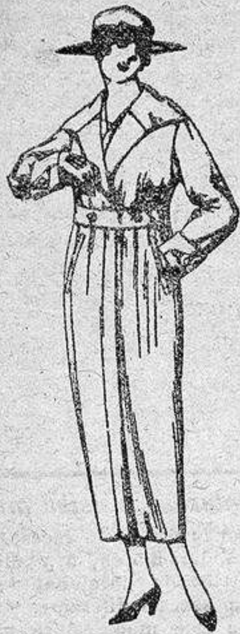
Guardapolvos de gabar: dilla, dril y alpaca, colores beige, kaki, gris, etcétera, de ptas. 22 a 35.