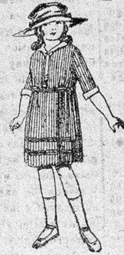
Vestidos de voile, listados, adornos blancos, para niñas de 4 a 9 años, de ptas. 22 a 32.