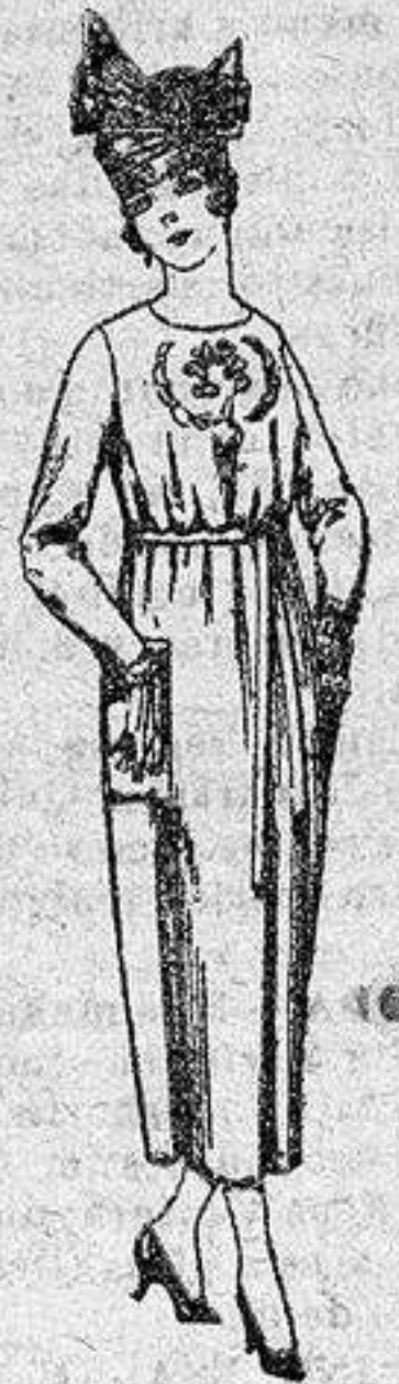
Vestidos de tricot de lana, en azul y colores, bordados a mano, a pesetas 112.

PRECIO FIJO - Pídase el catálogo general