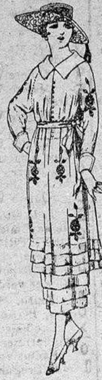
Vestidos de etamín blanco, azul y color, adornos bordados, de ptas 50 a 68.